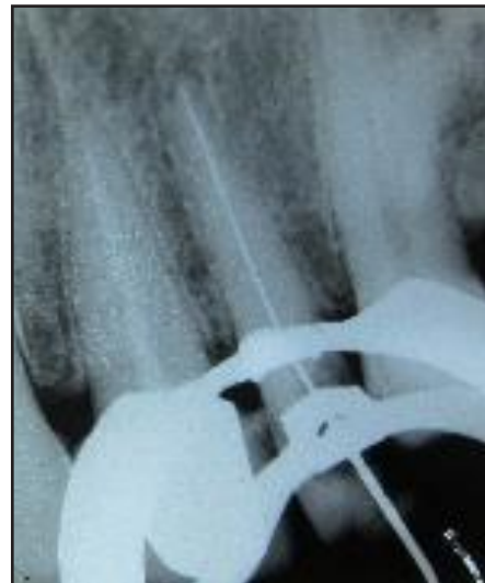
Gambar 2. Radiograf pengukuran PK estimasi K-file #40

Kemudian dilanjutkan dengan preparasi saluran akar tehnik konvensional dengan PK 22mm. Setiap pergantian file pada preparasi saluran akar, dilakukan irigasi dengan NaOCl 2,5% dan file dilumasi dengan EDTA. Bahan irigasi yang digunakan yaitu NaOCl 2,5%, EDTA dan CHx 2%. Dilanjutkan dengan pemberian intra canal medikamen \text{Ca(OH)}_2 yang dicampur dengan CHx 2% dimasukkan ke dalam saluran akar, kemudian ditumpat sementara.