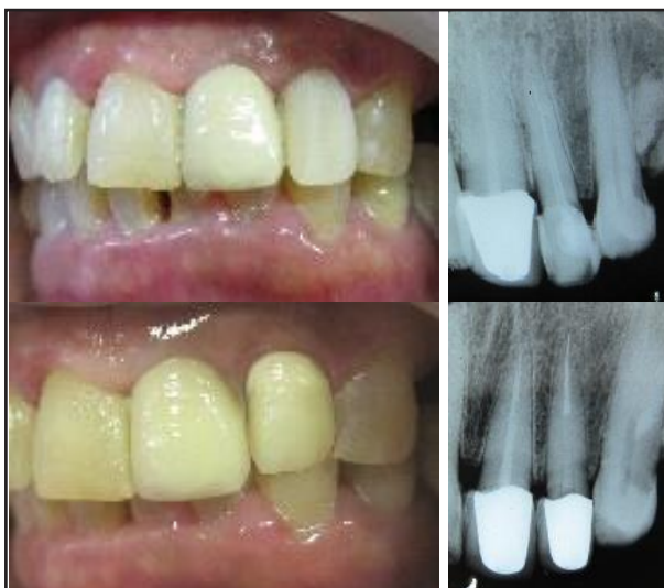
Gambar 4. Foto sebelum dan sesudah perawatan

Pada kunjungan III (16 Oktober). Kontrol PSA. Pasien tidak memiliki keluhan, perkusi dan palpasi negatif, dilanjutkan dengan preparasi pasak dan mahkota jaket porselin fusi metal (PFM). Pasak yang digunakan yaitu pasak fiber prefabricated (Fiberpost, Densply). Gutta perca dibuang menggunakan Gates glidden drill (2/3 dari panjang gigi didapat 16mm dan menyisakan gutta perca 6mm) kemudian menggunakan Peeso reamer dan precision drill . Pengepasan dan dikonfirmasi dengan foto radiografis. Penyemaman dengan semen resin dan dilanjutkan pembuatan inti resin. Cetak menggunakan rubber base , untuk gigi antagonis dilakukan pencetakan dengan alginat . Model dikirimkan ke dental lab.