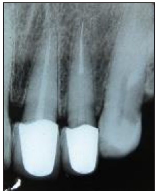
Gambar 5. Foto Radiograf setelah perawatan 6 bulan

Kunjungan V. dilakukan kontrol 6 bulan setelah PSA (Gambar 5), pada pemeriksaan subyektif tidak ada keluhan dan pemeriksaan obyektif perkusi dan palpasi negatif, oklusi tidak ada traumatik, mahkota PFM masih terpasang dengan baik dan pasien merasa nyaman