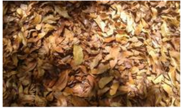
Gambar 2. Kondisi seresah di bawah tegakan mahoni umur 9 tahun.

Pada tanaman mahoni umur 5 tahun kondisi tanaman pokok relatif sudah agak besar (rata-rata tinggi berkisar 5,49 – 5,80 dengan penutupan tajuk 34,87 – 35,46 m 2 per petak ukur). Kondisi tanaman pokok tersebut sudah bisa memproduksi seresah di bawah tegakan sehingga keberadaan seresah sangat berperan dalam pengendalian erosi. Sedang pada