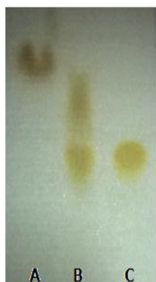
Gambar 1. KLT ekstrak terpurifikasi I, fase diam silika gel 60F 254, fase gerak n -butanol: asam asetat: air (3: 1: 1 v/v) deteksi pada sinar tampak. Keterangan: (a) kuersetin, (b) ekstrak terpurifikasi I (c) rutin

pada Rf 0,56 dan 0,69 sedangkan Rf standar rutin 1% adalah 0,56 dan kuersetin 0,81. Pada pengukuran selanjutnya digunakan rutin sebagai pembanding karena adanya kesamaan bercak. Adanya bercak kedua dengan Rf mendekati rutin dimungkinkan kandungan flavonoid dalam ekstrak adalah glikosida sehingga perhitungan kadar flavonoid total dihitung sebagai rutin. Hasil KLT disajikan pada Gambar 1.