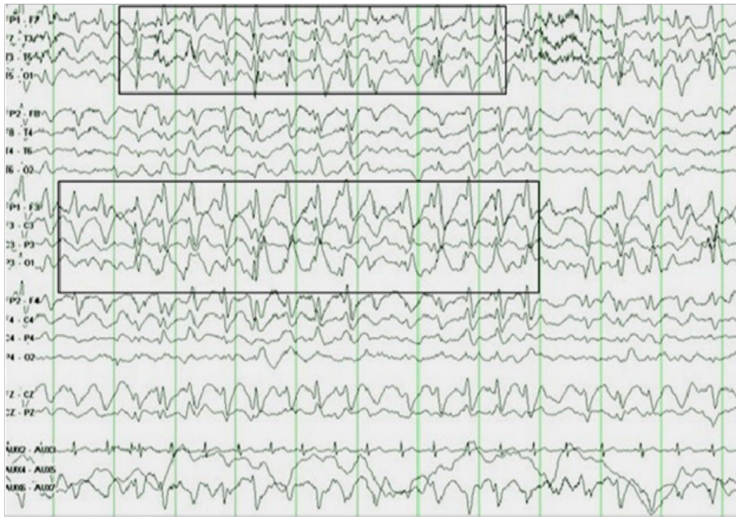
Gambar 6. EEG menunjukkan gelombang spike and slow central kanan IEDs dan fokal lambat pada pasien tumor frontal kanan dengan kejang parsial. 5

Pada tumor derajat rendah, karena perkembangannya lambat maka akan terjadi perubahan sel yang secara perlahan akan mengganggu neurotransmitter dan modulator di sinaps sehingga dapat menyebabkan epileptogenesis. 8 Pada tumor derajat tinggi terjadi perubahan mendadak kerusakan jaringan melalui nekrosis jaringan dan terjadi endapan hemosiderin yang ditengarai memicu epileptogenesis. Proses mekanik desak ruang tumor menyebabkan menurunnya perfusi darah, terjadi hipoksia sel neuron, penumpukan asam laktat, perubahan PH yang menjadi asam, yang mengganggu fungsi sel neuron yang meliputi sinaps dan menginduksi peningkatan glutamat sehingga berperan dalam epileptogenesis. 8