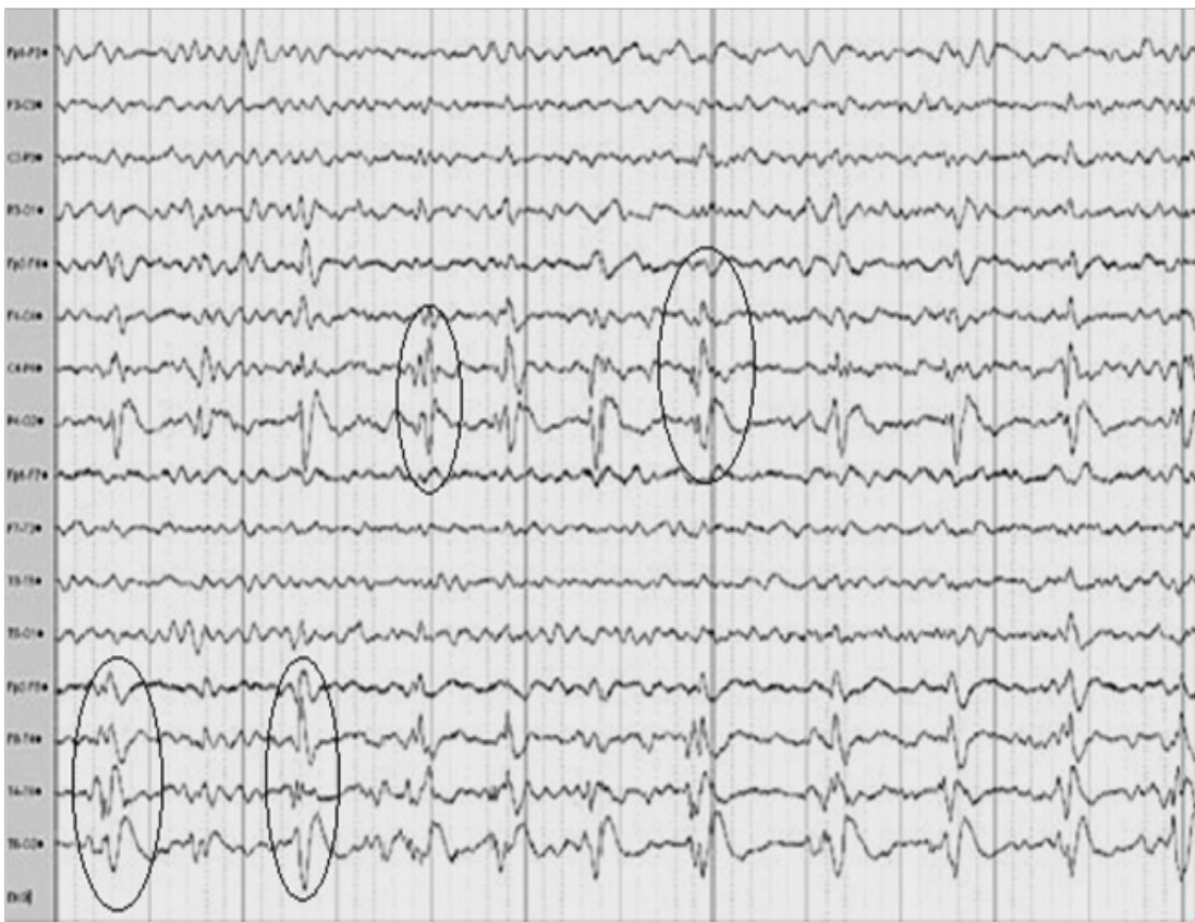
Gambar 5. PLEDs temporal kiri pada pasien tumor glioma berusia 51 tahun. 5