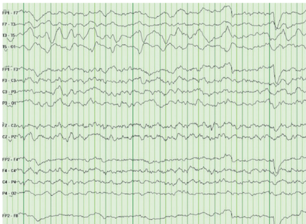
Gambar 1. Polymorphic Delta Activity di hemisfer kiri pada pasien tumor otak. 4

Gambaran EEG pada tumor otak juga dapat berupa gelombang epileptiform. Meskipun epileptogenesis pada tumor otak sebenarnya belum jelas, tetapi terdapat beberapa teori yang digunakan untuk menjelaskan mekanisme tersebut, dan kemungkinan penyebabnya melibatkan banyak faktor. 6 Aktivitas epileptogenik berasal dari daerah sekitar tumor karena lesi tumor biasanya tidak mempunyai aktivitas listrik. 7 Pada daerah tersebut terdapat ketidakseimbangan antara mekanisme inhibitorik dan eksitatorik intrakortikal yang didominasi oleh eksitatorik. 6,7 Mekanisme epileptogenesis berhubungan dengan tipe tumor, morfologi jaringan peritumoral, lingkungan mikro, dan faktor genetik. 8 Pasien tumor otak dengan kejang dapat menunjukkan gambaran interiktal pada EEG. 9,10 Lamanya durasi kejang juga dapat berhubungan dengan luasnya daerah lesi di otak. 11 Gelombang spike, sharp , atau spike-wave complexes yang terjadi secara konsisten di area lokal, jarang ditemukan pada awal perjalanan tumor otak. Pasien kejang dengan tumor dapat terjadi periodic lateralized epileptiform discharge (PLED). 5