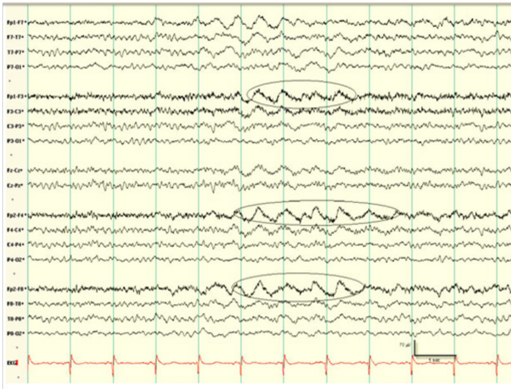
Gambar 2. Frontal intermitten rhythmic delta activity (FIRDA) pada pasien glioma subkortikal berusia 67 tahun. 5