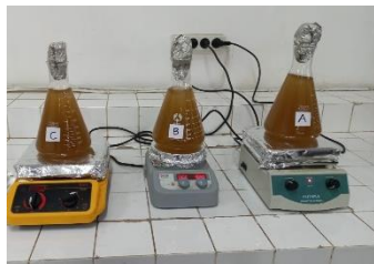
Proses pengadukan dengan alat magnetik stirrer selama 6, 12, dan 24 jam