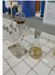
Proses partisi dengan alat corong pisah