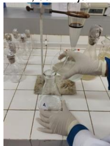
Dipisahkan bagian yang terpisah dari minyak