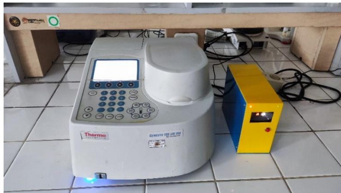
Gambar 3. Smart relay dihubungkan dengan Spektrofotometer

Ketika Gambar QR yang dipindai berisi data yang sesuai dengan kata kunci di dalam program, maka lampu LED warna hijau akan menyala dan peralatan laboratorium yang dihubungkan dengan smart relay akan mendapat input listrik sehingga peralatan tersebut menyala. Setelah selesai menggunakan peralatan, tekan tombol RESET, maka lampu LED warna hijau akan mati dan jalur listrik ke peralatan akan terputus yang menyebabkan peralatan mati. Ketika Gambar QR yang dipindai berisi data yang berbeda dengan kata kunci di dalam program, maka smart relay tidak merespon. 1 rangkaian alat smart relay hanya bisa diisi dengan 1 kata kunci. Apabila alat ini akan digunakan di peralatan laboratorium yang lain maka data kata kunci pada programnya harus diubah.