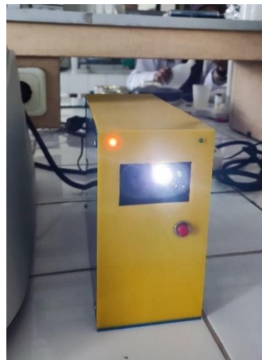
Gambar 2. Tampak depan kotak smart relay (smart relay)

Langkah selanjutnya setelah menuliskan program di Arduino IDE adalah mengirim program tersebut ke Arduino UNO. Setelah program terkirim ke Arduino UNO, maka koneksi Arduino dengan laptop bisa diputus. Untuk menggunakan rangkaian yang telah dibuat dapat menggunakan adaptor power 5 Volt DC di Arduino UNO.