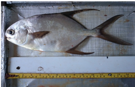
Gambar 1. Bawal Bintang ( Trachinotus blochii ).

Alat yang digunakan diantaranya Keramba Jaring Apung (KJA) untuk wadah pemeliharaan bawal bintang, syring untuk penyuntikkan hormon dan beberapa alat pendukung.