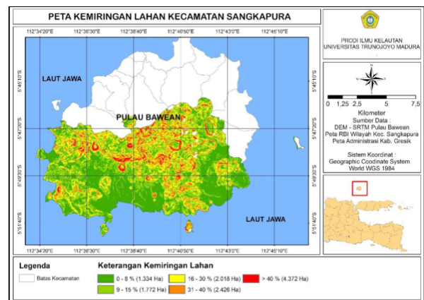
Gambar 1. Peta Ketinggian dan Kemiringan Lereng Wilayah Bagian Selatan Pulau Bawean