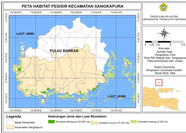
Gambar 2. Peta Sebaran Ekosistem Hutan Mangrove, Padang Lamun dan Terumbu Karang di Bagian Selatan Pulau Bawean.