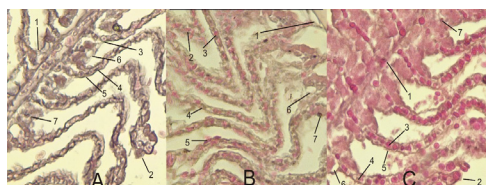
Gambar 4. Sampel histologi insang Istiblennius edentulus (a), Istiblennius dussumeri (b), dan Istiblennius lineatus (c) dengan mikroskop Leica pada perbesaran 10X40 menunjukkan lamella primer (1), lamella sekunder (2), sel eritrosit (3), sel pilar (4), sel epitel (5), sel mukus (6), dan sel klorit (7).