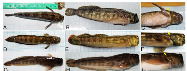
Gambar 1. Foto Istiblennius edentulus pada sisi dorsal (a), sisi samping (b), dan sisi ventral (c), foto Istiblennius dussumeri pada sisi dorsal (d), sisi samping (e), dan sisi ventral (f), dan foto Istiblennius lineatus pada sisi dorsal (g), sisi samping (h), dan sisi ventral (i).

Sampling ikan dilakukan di zona intertidal pantai Krakal. Dari aktivitas sampling ditemukan 15 sampel famili Blenniidae yang terdiri dari 3 spesies, yaitu Istiblennius edentulus , Istiblennius dussumeri , dan Istiblennius lineatus , tiap spesies diambil 5 individual sampel.