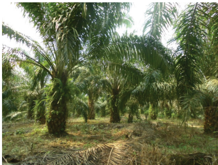
Gambar 2. Kondisi tajuk di ekosistem perkebunan kelapa sawit. Figure 2. Canopy in oil palm plantation ecosystem

Faktor berikutnya yaitu pH tanah, ketiga ekosistem memiliki pH sedikit asam yaitu 4 untuk hutan sekunder, kebun karet, perkebunan kelapa sawit dan 5 (netral) untuk hutan karet. Kondisi pH tanah ini masih toleran untuk semut, artinya semut masih dapat hidup dengan baik (Rahmawati 2004).