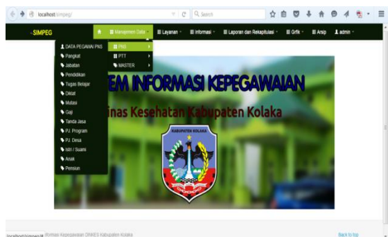
Gambar 3. Tampilan Menu Manajemen Data (input)

Menu manajemen data berfungsi untuk menambah, mengubah dan menghapus data PNS, data PTT dan mengelola data master. Modul manajemen data PNS meliputi data pegawai, riwayat kepangkatan, riwayat jabatan, riwayat pendidikan, riwayat diklat, riwayat tanda jasa, riwayat keluarga, data penanggung jawab program, data penanggung jawab desa, data pensiun, data pegawai pendidikan, data gaji dan data pindah (seperti yang ditunjukkan pada gambar 3). Manajemen pegawai tidak tetap meliputi data PTT, riwayat pendidikan dan riwayat pekerjaan. Manajemen data master meliputi data jurusan, data gaji pokok, data unit kerja. Pada menu manajemen data, semua data yang dibutuhkan sebagai data input di entri pada form yang sudah tersedia. Salah satu contoh Form input berupa form data penanggung jawab program seperti yang terlihat pada gambar 4.