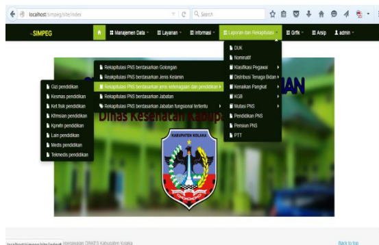
Gambar 5. Tampilan Menu Laporan dan Rekapitulasi Pegawai berdasarkan Jenis Ketenagaan dan Pendidikan

Output merupakan hasil akhir yang dihasilkan oleh sistem informasi. Hasil akhir pada umumnya berupa dokumen yang dicetak melalui printer komputer. Hasil akhir dapat digunakan dalam membantu pengambilan keputusan pada tingkat manajerial tertentu sesuai dengan laporan yang dibutuhkan. Salah satu output yang penting dan dibutuhkan oleh pengguna di dinas kesehatan yaitu laporan dan rekapitulasi pegawai berdasarkan jenis ketenagaan-pendidikan yang terdiri dari tenaga medis, keperawatan, kefarmasian, kesehatan masyarakat, gizi, keteknisan medis, keterampilan fisik dan tenaga lain seperti yang tampak pada gambar 5 berikut: