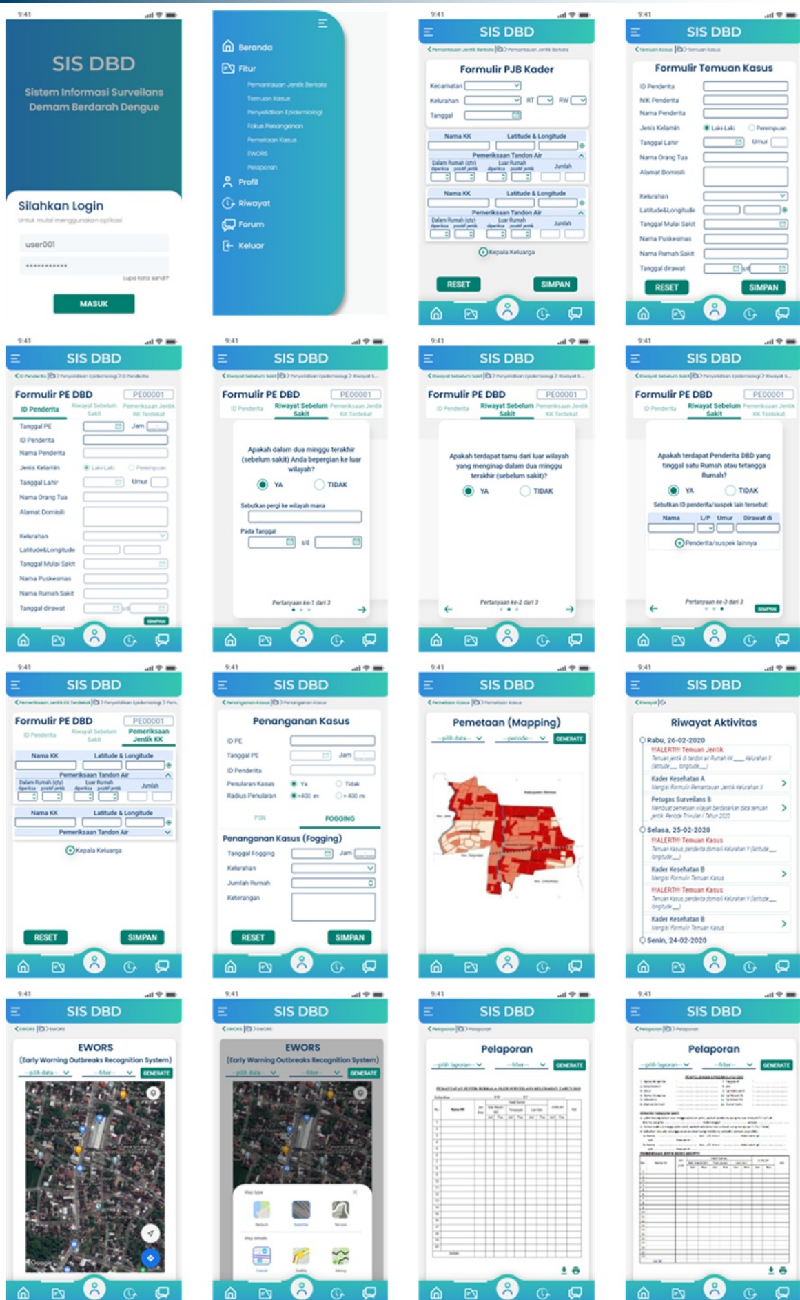
Gambar 3. Tampilan Antarmuka Pengguna Sistem Informasi Surveilans DBD