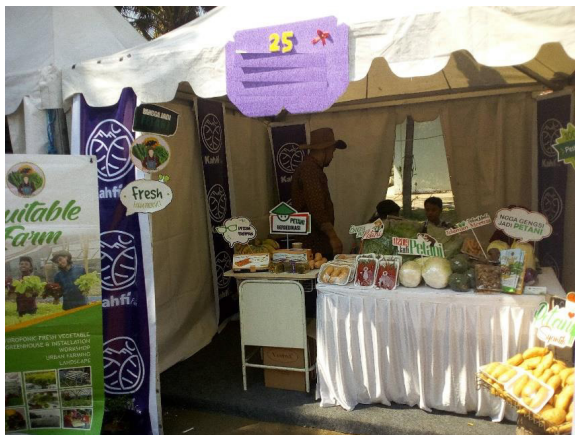
Gambar 3 Pengalaman Generasi Muda Terdidik dalam Kegiatan Pameran Wirausaha Pertanian

terdidik menilai lebih mudah memperoleh informasi wirausaha pertanian dari lingkungan teman-teman daripada orang tua dan keluarga. Penelitian oleh Suwanto, Mayasari, dan Dhari pada tahun 2021, memberikan saran untuk generasi muda agar dapat memilih teman yang dapat mendukung keputusan karir di masa depan (Suwanto et.al. , 2021).