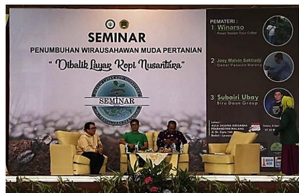
Gambar 4 Forum Seminar yang Difasilitasi Sekolah

Akses informasi melalui sekolah secara keseluruhan adalah mudah (65,56%) bagi generasi muda terdidik dalam memperoleh informasi wirausahawan pertanian. Sekolah dalam hal ini telah menyediakan berbagai media untuk generasi muda terdidik memperoleh informasi dan pengetahuan terkait wirausaha pertanian, seperti perkuliahan kewirausahaan pertanian di kelas, seminar, pelatihan, dan kegiatan studi lapangan. Sekolah juga menyediakan fasilitas akses informasi wirausaha pertanian, seperti perpustakaan sekolah dan jaringan internet bagi generasi muda terdidik. Hasil penelitian dapat memberikan implikasi yaitu generasi muda terdidik memperoleh informasi kewirausahaan pertanian secara mudah dari sekolah, sehingga dapat mendukung terbentuknya sikap yang positif terhadap wirausaha di sektor pertanian. Temuan tersebut sejalan dengan penelitian oleh Haryanto dan Helmi pada tahun 2020 menjelaskan bahwa pendidikan berperan dalam mengasah