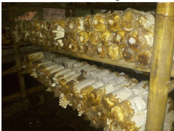
Gambar 2 Usaha Budidaya Jamur Tiram oleh Generasi Muda Terdidik di STPP Bogor

Akses informasi melalui peer-group secara keseluruhan dinilai mudah (60,23%) oleh generasi muda terdidik. Hasil demikian bermakna bahwa generasi muda terdidik secara umum menilai mudah untuk memperoleh informasi wirausaha pertanian dari lingkungan teman-teman peer-group . Hasil ini berbeda dengan akses informasi melalui keluarga, yang hanya dinilai cukup mudah oleh generasi muda terdidik. Seringkali seseorang pada usia muda atau usia sekolah lebih banyak berinteraksi dan berkomunikasi dengan teman sekelompoknya daripada dengan orang tua atau keluarga sendiri. Hal tersebut sesuai dengan temuan penelitian oleh Rahmasari, Setiyawan, dan Nur pada tahun 2024 yang menyatakan bahwa dinamika peer-group dapat membentuk perilaku generasi muda (Rahmasari et.al. , 2024). Selain itu, sebagian besar generasi muda terdidik pada penelitian merupakan mahasiswa IPB yang tidak tinggal bersama orang tua atau keluarga. Kondisi tersebut telah menyebabkan generasi muda