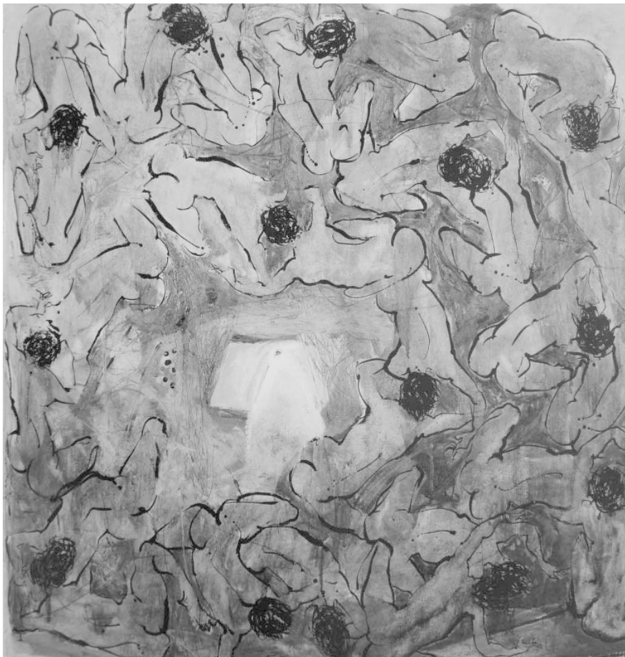
Gambar 2. Putu Sutawijaya, “Dialog IX” (180 x 180 cm, cat minyak di atas kanvas, 2000).

massal ini adalah ketiadaan identitas. Kehadiran mereka tanpa identitas yang pasti. Oleh karenanya, problem pertama yang akan kita hadapi di sini adalah problem identifikasi: konstitusi identitas mereka sebagai sosok-sosok yang anonim. Berbeda dengan kelompok dan gerombolan ( crowd ), apa yang disebut sebagai massa adalah “tak-terbatas”, tak terhitung jumlahnya; dan, dengan demikian, sulit untuk diidentifikasi. Kita memang bisa saja memerikan beberapa ciri tertentu dari tubuh-tubuh massal di dalam lukisan-lukisan PS. Misalnya saja, tubuh-tubuh itu menampilkan kecenderungan sebagai tubuh yang