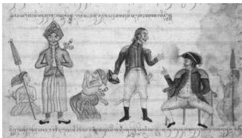
Gambar 4. Naskah Blambangan Purwasatra , 1804, Koleksi British Library, London