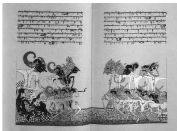
Gambar 1. Naskah " Bharatayudha", 1901-1903.

Naskah-naskah periode ini kebanyakan ditulis dalam rentang waktu 150 tahun akhir masa kolonial - hingga menjelang Revolusi Kemerdekaan Indonesia.