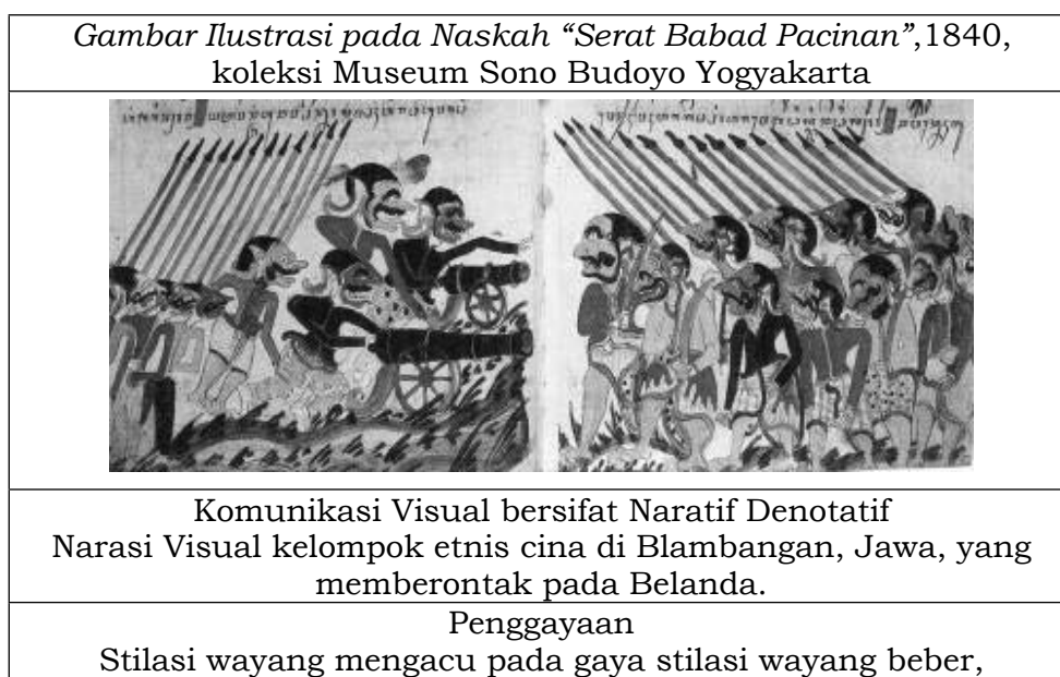
Gambar Tabel 1. Pembacaan Gambar Ilustrasi “ Serat Babad Pacinan ”,1840

Wujud visual ilustrasi pada naskah-naskah Jawa periode 1800-1920 memperlihatkan kesinambungan wujud visual dan keunikan yang khas. Pengayaan Ilustrasi pada Naskah Jawa sebagian besar masih memperlihatkan kecenderungan gaya stilasi wayang kulit khususnya gaya stilasi Wayang Beber Jawa (abad 16) dan Wayang Kulit Jawa (abad 16) yang cukup dominan. Hal tersebut menunjukkan bahwa di masa