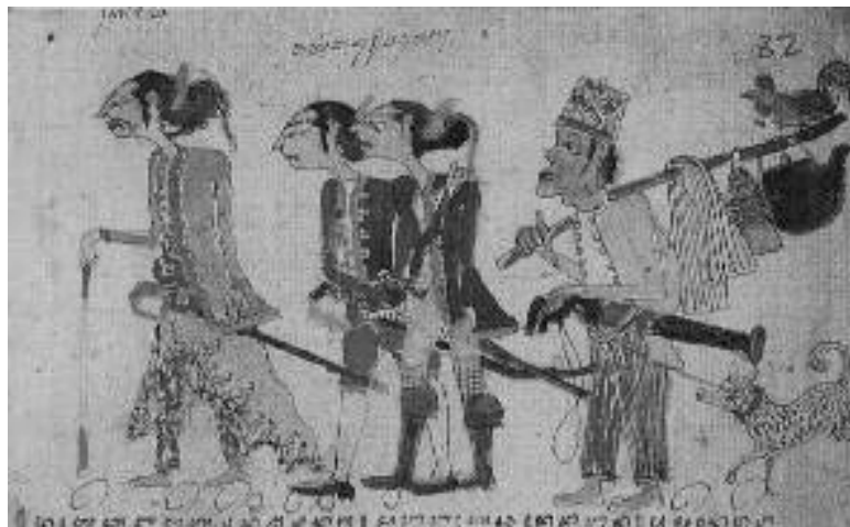
Gambar 3. Naskah Damar Wulan , 1815, Koleksi British Library, London

Gambar ilustrasi pada naskah Jawa periode tahun 1800-1920 secara visual mengomunikasikan pesan-pesan mengenai perubahan kosmologi rakyat