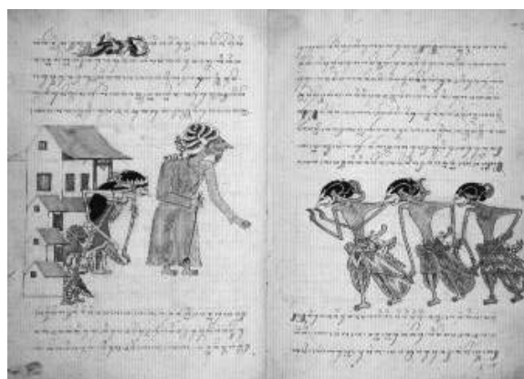
Gambar 2. Naskah Panji Selarasa, 1880

Naskah Jawa merupakan catatan penting dan seringkali berkaitan dengan dengan peristiwa penting yang terjadi pada masa dibuatnya sehingga selalu memiliki nilai sejarah yang merupakan hasil gubahan dari naskah periode sebelumnya. Naskah Jawa sebelumnya kebanyakan disusun dalam bentuk tembang macapat sedangkan pada periode ini memiliki keunikannya karena sebagian naskah Jawa memuat gambar ilustrasi. Menurut John Pemberton dalam bukunya, Jawa (2003) sebagian naskah-naskah yang dibuat pada abad ini memuat tentang dampak akibat budaya kolonial Belanda terhadap kebudayaan Jawa, khususnya pada naskah-naskah keraton