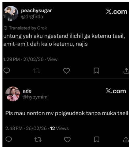
Gambar 2. Tweet NCTzen terkait Moon Taeil di 2026

Dimensi terakhir adalah visibilitas yang bersifat enduring atau bertahan lama. Jejak digital dari aksi cancel culture ini menempel secara permanen pada identitas digital Moon Taeil. Walaupun kasus tersebut ramai pada tahun 2024, citra buruk yang dimiliki oleh Moon Taeil menempel hingga saat ini, terbukti dari banyaknya NCTzen yang masih kerap menghubungkan hal-hal negatif dengan Moon Taeil.