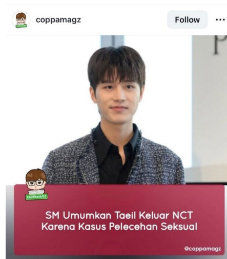
Gambar 3. Berita Kasus Moon Taeil di Instagram

Lebih lanjut lagi, konsep lateral surveillance merujuk pada kondisi yang lebih luas, yang di dalamnya individu memantau perilaku individu lain (Andrevij, 2005 dalam Trottier, 2017). Pada konteks kasus Moon Taeil, NCTzen aktif menelusuri, memproduksi, dan mendistribusikan informasi berkaitan dengan kasus Moon Taeil. Dalam kerangka vigilantisme digital, lateral surveillance berfungsi sebagai mekanisme pengumpulan bukti yang kemudian digunakan untuk melegitimasi tindakan canceling . Dinamika sosial yang melintasi konsep ini adalah bahwa individu mengawasi individu lain, sekaligus mengawasi diri mereka sendiri. Hal ini menunjukkan upaya yang lebih luas untuk mengontrol aliran informasi. Bentuk praktik pengawasan lateral dapat dilihat pada cuitan dari akun @nct_menfess berikut.