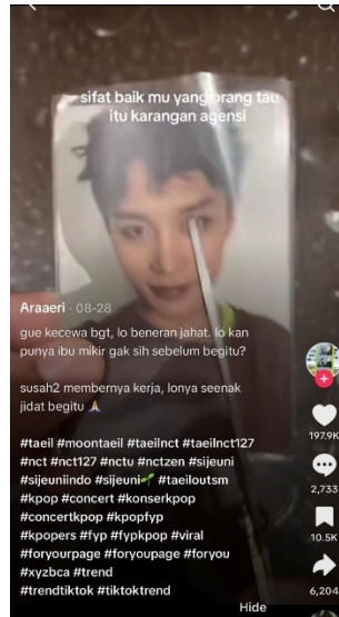
Gambar 1. Potongan Photo Card Moon Taeil

Tindakan seperti ini menunjukkan bagaimana ekspresi kritik terhadap publik figur tidak hanya dilakukan melalui pernyataan verbal, tetapi juga melalui tindakan simbolis yang direkam dan disebarluaskan secara digital. Konten di atas merupakan bagian dari penghukuman sosial yang dilakukan oleh NCTzen sebagai respons terhadap kasus Moon Taeil. Konten ini membungkus kemarahan dengan tindakan memperlakukan foto dari idola yang bersangkutan, yang kemudian diunggah ke publik sehingga dapat diakses dan dilihat oleh khalayak luas.