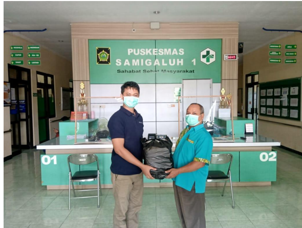
Gambar 6. Penyerahan APD