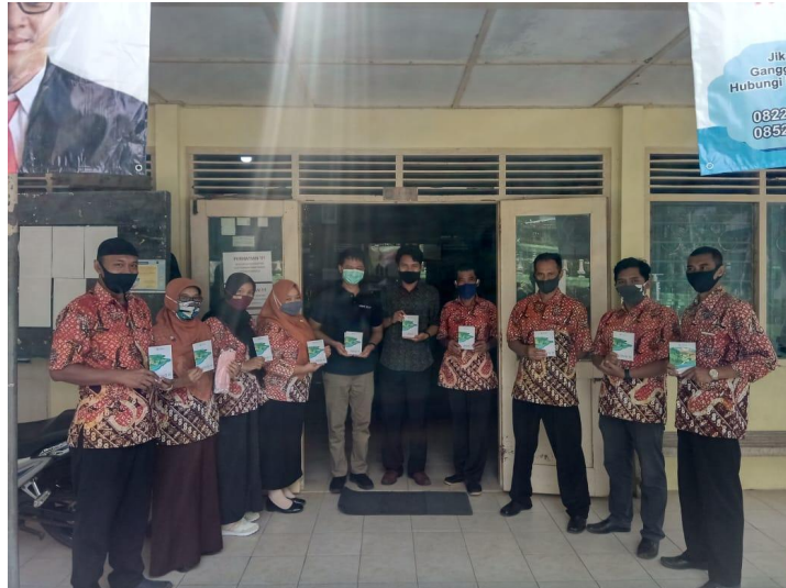
Gambar 4. Penyerahan Bantuan kepada Pemerintah Desa