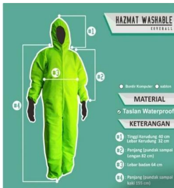
Gambar 5. Alat Pelindung Diri (APD)

tim kepada Kepala Tata Usaha Puskesmas Samigaluh 1 (Gambar 7). Alat pelindung diri tersebut dapat digunakan lagi setelah dicuci dengan langkah yang benar menggunakan detergen dan/atau pemutih. Hal ini berguna untuk mengoptimalkan penggunaan APD.