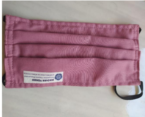
Gambar 2. Masker Kain Reusable

Penggunaan masker di masa pandemi Covid-19 ini menjadi hal yang sangat penting untuk memproteksi diri dan juga orang lain dari risiko penularan virus ini (Sari D.P, 2020). Hal ini sebagai langkah untuk meminimalisir