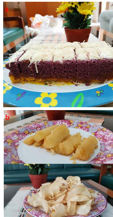
Gambar 2. Hasil olahan inovasi produk singkong (a) bolu kukus lapis; (b) singkong goreng

Pada sesi kedua, setelah penyuluhan materi perizinan P-IRT, disampaikan materi inovasi produk. Selain kendala yang berkaitan dengan perizinan P-IRT, para pelaku usaha di Desa Tirtoadi juga mengalami kendala inovasi produk. Salah satu kendala inovasi produk yang dihadapi berkaitan dengan variasi hasil olahan makanan yang sedikit. Contohnya adalah hasil olahan dari singkong yang hanya dibuat menjadi keripik dan makanan tradisional ( timus, cemplon, endog gludug ). Di Desa Tirtoadi, sangat banyak ditemukan tanaman singkong, tetapi para pelaku usaha belum memanfaatkannya secara maksimal. Terkait hal itu, narasumber memberikan pengetahuan tentang langkah-langkah berinovasi, yaitu melalui informasi. Informasi dapat berasal dari berbagai sumber, salah satunya dari media elektronik (internet). Para peserta menyimak dengan cermat dan antusias saat bertanya serta menjawab pertanyaan. Sesi ini diharapkan dapat menambah wawasan peserta dalam menemukan inovasi produk makanan. Secara rinci, contoh hasil olahan singkong dengan adanya inovasi dan tidak disajikan dalam (Gambar 2)