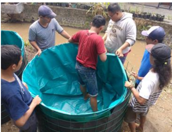
Gambar 3. Kegiatan pemasangan kolam untuk akuaponik

Dalam usaha budi daya ikan, pakan merupakan komponen utama yang membutuhkan biaya produksi paling tinggi (70%) (Purwadi, 2016). Oleh karena itu, keterampilan dalam membuat pakan mandiri merupakan hal wajib yang perlu dimiliki oleh setiap pembudi daya. Hal tersebut yang mendasari pelaksanaan pelatihan pembuatan pakan ikan mandiri. Pelatihan dilaksanakan pada 14–21 Juli 2019. Tujuan pelatihan adalah untuk membekali remaja karang taruna di Dusun Jetis dengan keterampilan membuat pakan ikan sehingga dapat menekan biaya produksi. Pelatihan ini juga menekankan pemanfaatan kearifan lokal guna meningkatkan nilai tambah dan mengurangi polusi (limbah). Kegiatan ini diikuti dengan antusias oleh peserta. Hal itu terlihat dari keaktifan peserta dalam sesi diskusi dan proses pembuatan akuaponik (Gambar 3).