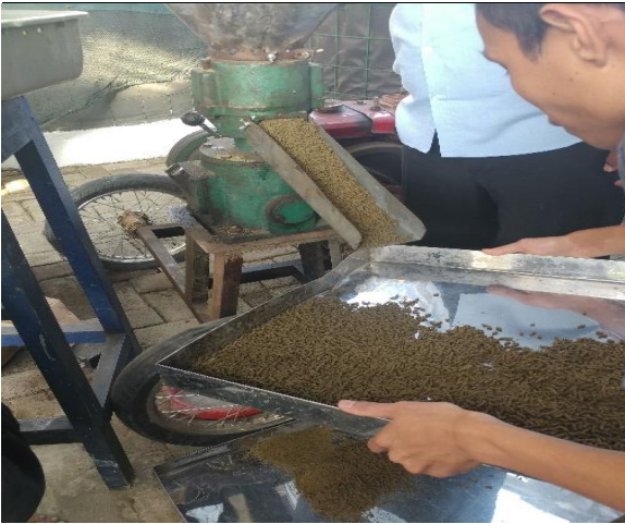
Gambar 5. Pakan hasil kegiatan pelatihan

Ikan dan sayuran yang dihasilkan dari kegiatan ini memiliki keunggulan, yakni bersifat organik, aman, sehat, dan halal karena dipelihara dengan cara higienis dan tanpa menggunakan bahan-bahan kimiawi (sintetis). Pakan ikan yang dihasilkan juga diharapkan akan dapat bersaing dengan kualitas pakan ikan pabrikan. Harga pakan mandiri juga lebih terjangkau, yaitu Rp. 8.500/ kg daripada harga pakan produksi pabrik, yaitu Rp. 12.500/ kg.