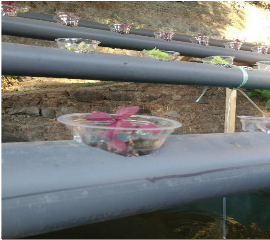
Gambar 1. Peletakkan bibit pada akuaponik

dilakukan pada trypot plastik (pot untuk penyemaian benih) dengan menggunakan media tanah yang telah diberi pupuk. Setelah bibit tumbuh setinggi \pm 10 cm, bibit tersebut dipindahkan ke pot plastik dan diletakkan di lubang akuaponik (Gambar 1).