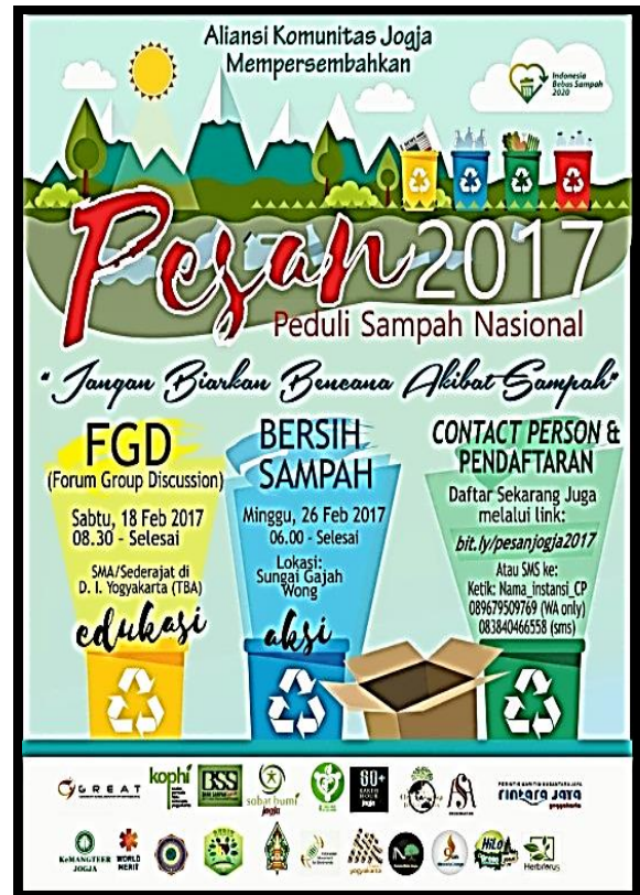
Gambar 1. Poster Kegiatan Peduli Sampah Nasional (PESAN) 2017

gerakan ini menyesuaikan dengan peringatan Hari Peduli Sampah Nasional yang jatuh pada tanggal 21 Februari. Hari Peduli Sampah Nasional sendiri merupakan peringatan tragedi longsornya tumpukan sampah di TPA Leuwigajah pada tanggal 21 Februari 2005. Seperti dikutip dari Kompas.com (21 Februari 2011), persis di hari Senin tepatnya pukul 02.00 dinihari saat tumpukan sampah di TPA Leuwigajah longsor. Datang bak gelombang tsunami, sampah anorganik berupa plastik, gabus, kayu, hingga sampah organik menghantam dua pemukiman yakni Kampung Cilimus dan Kampung Pojok. Pemukiman yang penuh kehidupan itu langsung luluh lantak tertimbun sampah meski berjarak satu kilometer lebih dari puncak tumpukan sampah. Gunung sampah sepanjang 200 meter dan setinggi 60 meter itu goyah karena diguyur hujan deras semalam suntuk dan terpicu konsentrasi gas metan dari dalam tumpukan sampah. Sampah di TPA itu memang menggunakan sistem open dumping yakni dibuang dan ditumpuk begitu saja. Akibat kejadian tersebut, tercatat 157 orang meninggal dunia, belum termasuk harta benda yang lain. Inilah musibah yang barangkali tercatat pertama kali dalam sejarah peradaban manusia, ratusan nyawa melayang gara-gara tertimbun sampah.