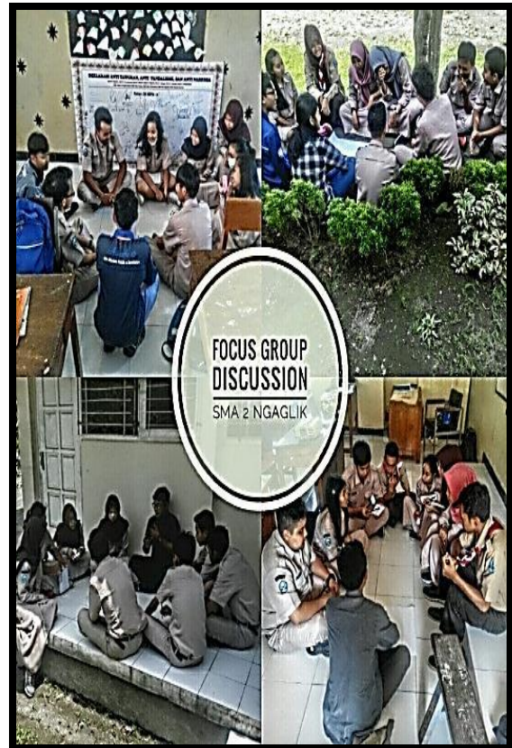
Gambar 2. Kegiatan FGD Peserta Edukasi Lingkungan di SMA 2 Ngaglik

biasa. Siswa diberi kesempatan untuk mengeluarkan ide-idenya terkait pengelolaan sampah.