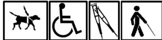
Gambar 2. Simbol target penyandang disabilitas (Nosek et al., 2007)

(2007; Gambar 2). Stimulus atribut merupakan modifikasi dari penelitian Wang et al. (2012) yang telah disesuaikan dengan survei awal peneliti mengenai stigma kepada penyandang disabilitas di Indonesia. Setiap stimulus atribut tersusun atas elemen kognitif, afektif, dan perilaku (Tabel 2).