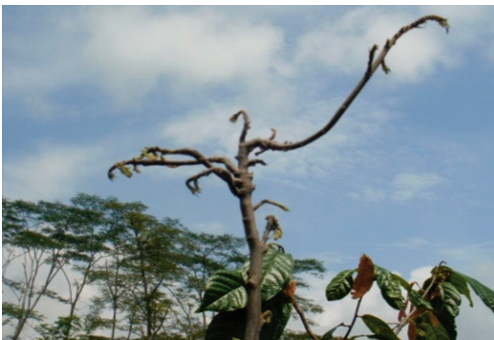
Gambar 3. Ujung tunas ranting yang ditumbuhi daun-daun kecil pada tanaman tua