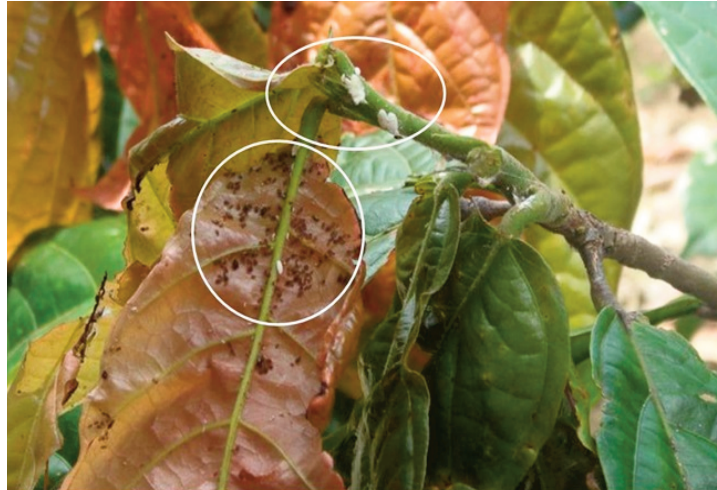
Gambar 6. Serangga yang berasosiasi dengan tanaman kakao di PT Pagilaran Samigaluh [ Aphid sp. dan kutu dompolan ( Planococcus spp.)]