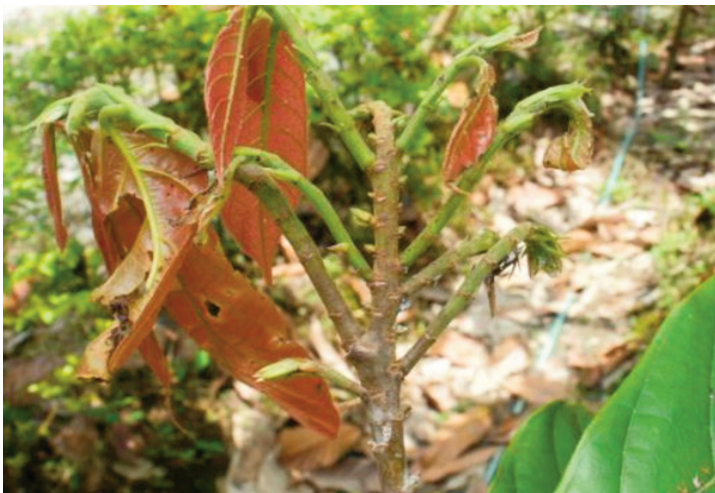
Gambar 2. Gejala pembentukan ranting bercabang banyak yang ditumbuhi daun-daun kecil pada pada ujung tunas ranting tanaman kakao muda