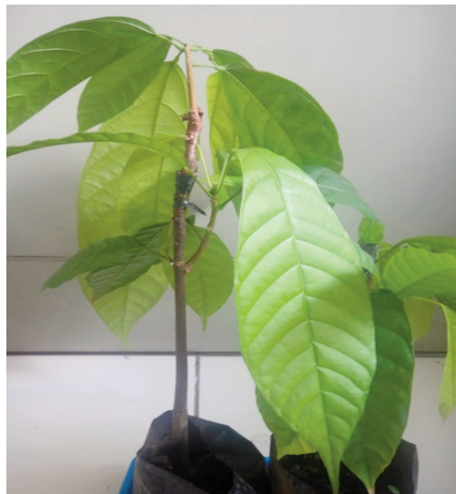
Gambar 7. Tunas yang tumbuh pada batang yang telah disambung tampak sehat (normal)

bungan yang tumbuh semuanya menghasilkan tunas yang sehat menunjukkan bahwa penyebab gejala malformasi tersebut bukan suatu patogen yang dapat ditularkan. Apabila disebabkan oleh patogen yang sifatnya sistemik maka dengan proses pertautan kambium antara batang sehat dan batang sakit akan dapat menyebarkan patogen tersebut secara sistemik baik secara aktif maupun pasif ke seluruh bagian tanaman.