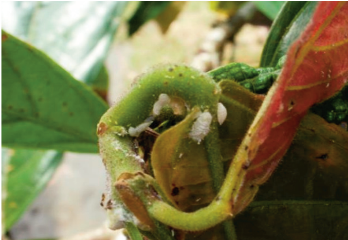
Gambar 1. Gejala pangkal ranting dan tangkai daun membengkak serta daun keriting pada tunas ranting tanaman kakao