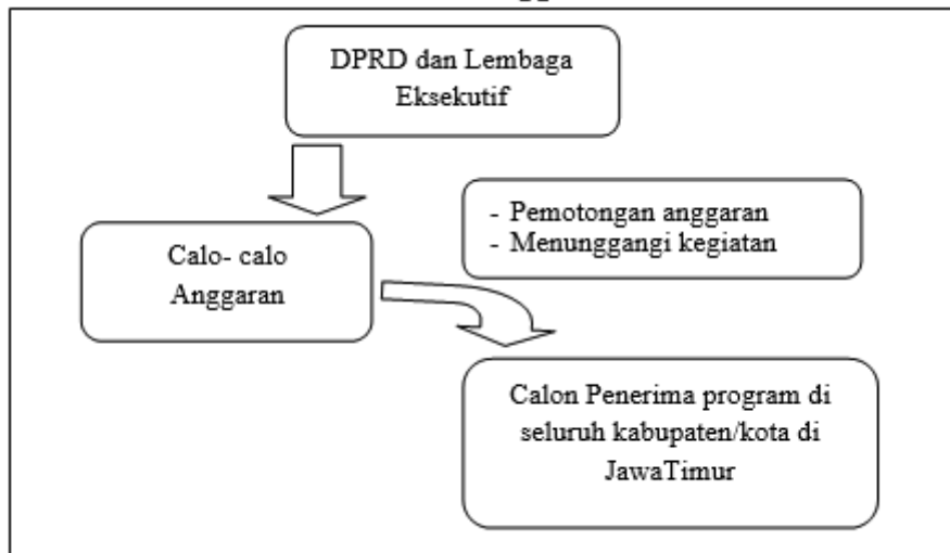
Gambar 2. Peran Calo anggaran