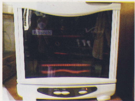
Gambar 2. Sterilisator infra red

Ozon merupakan suatu bentuk oksigen alotropis (gabungan beberapa unsur) yang setiap molekulnya memuat tiga jenis atom. Formula ozon adalah O 3 , berwarna biru pucat dan merupakan gas yang sangat beracun dan berbau sangat tajam serta dapat mendidih pada suhu ± 111,9°C (± 169,52°F), mencair pada suhu 192,5°C (- 314°F) dan memiliki gravitasi 2,144. Penghancuran bakteri pada sterilisasi