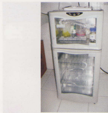
Gambar 4. Sterilisator ozon

sampai 20 menit untuk proses germinasi (perubahan spora menjadi bentuk sel vegetatif). Spora dari bakteri Bacillus lebih tahan dari bentuk vegetatifnya terhadap pemanasan, kekeringan, bahan preservatif makanan, dan pengaruh lingkungan lainnya (Naim, 2003).