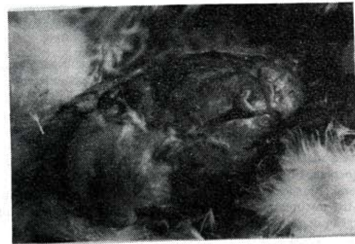
Gambar 2. Gambaran makroskopik poliserositis ayam percobaan yang mati akibat CRD-Complex.