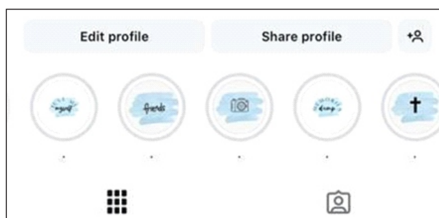
Gambar 3. Highlights Instagram

mereka sendiri dengan mengirimkan data secara berkala setiap enam bulan. Ini termasuk mengubah file ke format yang tahan lama (misalnya, tiff, mp4, dan pdf) dan melindungi data dengan menyimpan file di lokasi ganda.