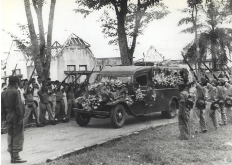
Figur 2. Letnan Kolonel Ahmad Yani (paling kiri) berperan sebagai perwira upacara berdiri di hadapan mobil jenazah yang mengangkut Letnan Jenderal Sudirman.

Sebagai contoh adalah Letnan Kolonel Soeprapto (kemudian lebih dikenal sebagai salah satu Pahlawan Revolusi). Pendidikan militer pertama Soeprapto adalah Koninklijke Militaire Academie . Namun, ketika Jepang masuk ke Hindia Belanda, Soeprapto ditahan karena dianggap sebagai kolaborator pemerintah kolonial Belanda. Kemudian, Soeprapto berhasil meloloskan diri dari tahanan Jepang dan tanpa identitas yang jelas bergabung dengan pendidikan militer yang dilaksanakan oleh Seinendan (Disjarah TNI AD, 1982: 35-36).