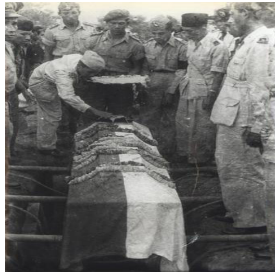
Figur 1. Peti jenazah Jenderal Sudirman di mulut liang lahat.

Utusan-utusan pemerintah yang hadir pada pemakaman inilah yang menaikkan pangkat Sudirman satu tingkat lebih tinggi menjadi Jenderal. Meskipun selalu lekat dengan pangkat Jenderal, sesungguhnya Sudirman wafat dengan pangkat satu tingkat di bawahnya. Namun, para pelayat yang berduka memang jarang menyebut namanya dengan pangkat yang ia sandang. Sudirman lebih sering disebut dengan gelar panglima, pangsar (panglima besar), atau “bapak TNI.”