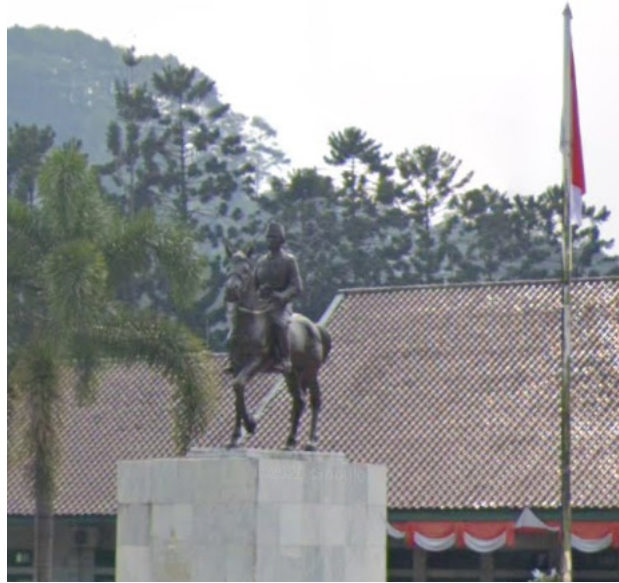
Figur 4. Patung Jenderal Sudirman di halaman depan Akademi Militer Magelang.

yang dipusatkan di Magelang, para calon taruna ini harus berjalan kaki selama tiga hari berturut-turut pada rute-rute yang di masa lampau pernah dilewati oleh pasukan gerilya Sudirman. Iring-iringan pasukan ini juga akan berhenti di titik-titik pemberhentian Sudirman, salah satunya adalah Desa Sobo, Pacitan, Jawa Timur. Sejak 2008, di desa tempat pemberhentian para calon taruna ini terdapat sebuah monumen raksasa Jenderal Sudirman yang dibangun oleh Presiden Susilo Bambang Yudhoyono. Pemilihan lokasi Pacitan sangat erat dengan latar belakang sang presiden yang berasal dari kabupaten ini. Selain itu, untuk penghayatan yang lebih dalam, secara bergiliran empat orang taruna diminta mengusung replika tandu Sudirman sepanjang mereka menempuh rute tersebut (Akabri, 1974: 6).