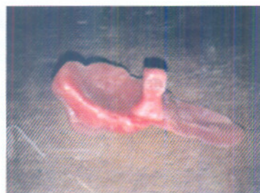
Gambar 4. Model malam dengan tempat magnet