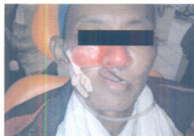
Gambar 3. Try in protesa hidung