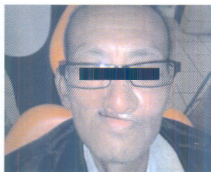
Gambar 6. Inseri protesa maksilofasial hidung dengan magnet.