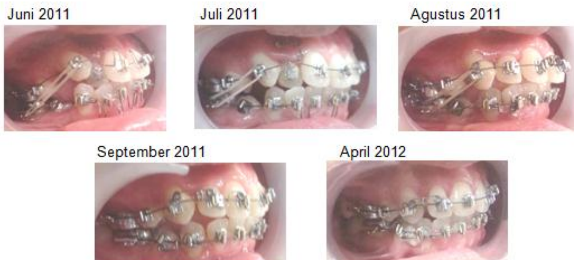
Gambar 5. Koreksi kaninus ektopik dengan teknik Begg pada tahap I

Tahap III perawatan teknik Begg bertujuan memperbaiki inklinasi aksial gigi-gigi RA dan RB ( root paralleling ) menggunakan plain archwire 0,020" dengan anchorage bend 15° di mesial molar pertama, circle hook pada mesial brakets kaninus, uprighting spring untuk koreksi gigi yang tilting , palatal/ lingual root torque untuk root paralleling gigi anterior RA dan RB, serta elastik intermaksiler klas II 5/16" 2 oz untuk mempertahankan overbite dan overjet .