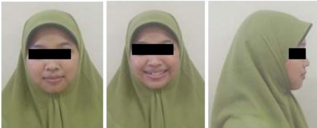
Gambar 1. Foto ekstraoral sebelum perawatan

Pemeriksaan ekstraoral menunjukkan profil yang cembung, tonus otot bibir normal, posisi bibir ketika istirahat normal tertutup (gambar 1). Pemeriksaan intra oral memperlihatkan kebersihan mulut sedang, ukuran lidah sedang, bentuk lengkung gigi atas dan lengkung gigi bawah parabola asimetris (Gambar 2)