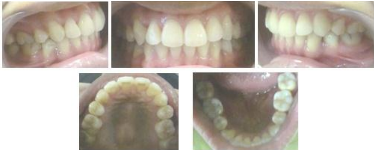
Gambar 7. Foto intraoral sesudah perawatan

Perawatan tahap I teknik Begg dilakukan selama 10 bulan. Pemakaian L loop dan vertikal loop archwire dalam 2 bulan, menghasilkan unreveling dan leveling gigi-gigi RA dan RB. Gigi 13 yang ektopik terekstrusi dan terdorong ke distal diikuti koreksi gigi 12 yang palatoversi. Koreksi dilanjutkan dengan menggunakan plain australian wire 0,016" selama 8 bulan, menghasilkan retraksi gigi anterior disertai koreksi malposisi gigi. Penegakan gigi 13 yang masih mesioversi menggunakan uprighting auxillary spring dilakukan sebelum retraksi gigi-gigi anterior.