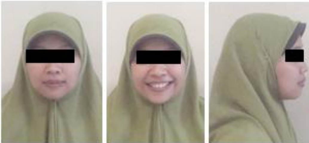
Gambar 6. Foto ekstraoral setelah 1 tahun perawatan