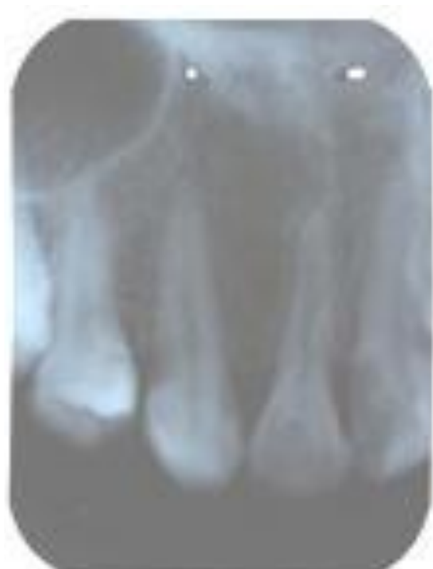
Gambar 8. Rontgen periapikal pada gigi 13 dan 12 setelah 1 tahun pemakaian retainer

Perawatan ortodontik kaninus maksila ektopik sering dikaitkan dengan resorpsi akar gigi insisivus lateral sebelahnya. Hal tersebut bervariasi berdasarkan posisi gigi kaninus, kekurangan ruang dan ada tidaknya pemandu erupsi, tahap perkembangan gigi sebelahnya, lokasi dan keparahan resorpsi akar. Resorpsi akar gigi insisivus atas tetap yang berdekatan dengan kaninus ektopik, dapat disebabkan oleh tekanan erupsi kaninus yang melekat saat reposisi, maupun adanya kontak fisik antara akar gigi insisivus dengan mahkota kaninus. 9