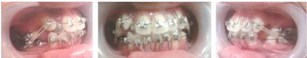
Gambar 3. Foto intraoral pada saat insersi alat ortodontik dengan teknik Begg

Rencana perawatan bertujuan memperbaiki gigi berjejal, openbite , cross bite , koreksi ovebite dan shif midline dengan menggunakan alat cekat teknik Begg. Berdasarkan perhitungan determinasi lengkung dan set up model Kesling setelah RA dan RB diretraksi sebesar 2 mm dan midline RB dikoreksi dengan bergeser ke kiri 1 mm, kebutuhan ruang pada RA untuk kasus ini adalah sebesar 13,1 mm sedangkan pada RB dibutuhkan ruang sebesar 9,4 mm. Kekurangan ruang yang dibutuhkan didapatkan dengan pencabutan empat gigi premolar pertama. Koreksi gigi kaninus maksila kanan ektopik dilakukan mulai tahap I perawatan menggunakan L loop archwire di mesial gigi 13, sedangkan untuk koreksi malposisi gigi lainnya menggunakan multiple vertical loop archwire (Gambar 3 dan 4)