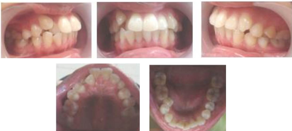
Gambar 2. Foto intraoral sebelum perawatan