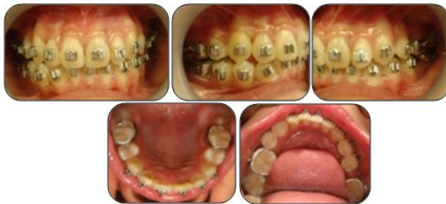
Gambar 6. Foto intraoral pasien setelah 14 bulan perawatan