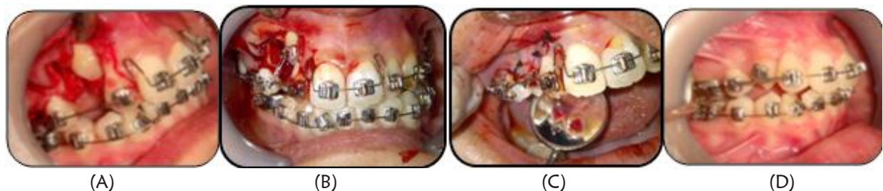
Gambar 4. (A)-(C) Exposure kaninus dengan closed eruption technique ; D. foto intraoral sisi kanan setelah 4 minggu perawatan)

Perawatan tahap pertama alat cekat sistem Begg bertujuan untuk levelling , unraveling , dan bite opening . 14 Gigi kaninus maksila impaksi dilakukan exposure secara simultan setelah dilakukan insersi braket kemudian ditarik secara bertahap sehingga mencapai garis oklusi dan menempati posisinya dalam legkung gigi. Pada tahap ini digunakan archwire 0,014" dilengkapi vertical loop , circle hook , anchorage bend 30° , dan elastik intermaksiler klas II 5/16" 2 oz serta open coil untuk distalisasi gigi 24 dan 35 dilanjutkan gigi 34. Pergeseran gigi-gigi selanjutnya dilakukan menggunakan elastik intramaksiler secara bertahap. Perubahan yang dapat diamati saat ini adalah kaninus maksila impaksi telah menempati posisinya, midline dental