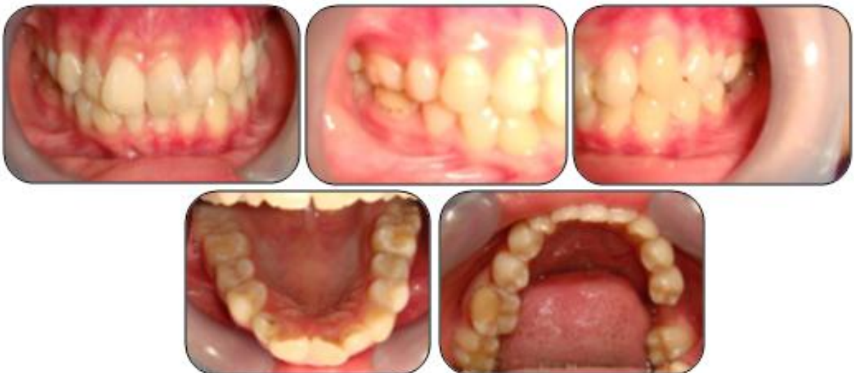
Gambar 2. Foto intraoral pasien sebelum perawatan

gigi maksila dan mandibula berjejal, tidak terdapat gigi kaninus kanan maksila dan insisivus lateral kanan mandibula, molar pertama kiri mandibula telah dicabut, serta garis tengah dental maksila dan mandibula bergeser ke kanan sejauh 2,5 mm dan 3,0 mm. Pemeriksaan model studi menunjukkan relasi molar pertama kanan klas I Angle. Overjet 3,00 mm, overbite 5,00 mm ( deepbite ) dan crossbite pada regio posterior kiri (gambar 1 dan gambar 2). Riwayat keluarga pasien memiliki ayah dengan ukuran gigi besar-besar dan susunan berjejal sehingga terdapat faktor genetik pada susunan gigi geligi.