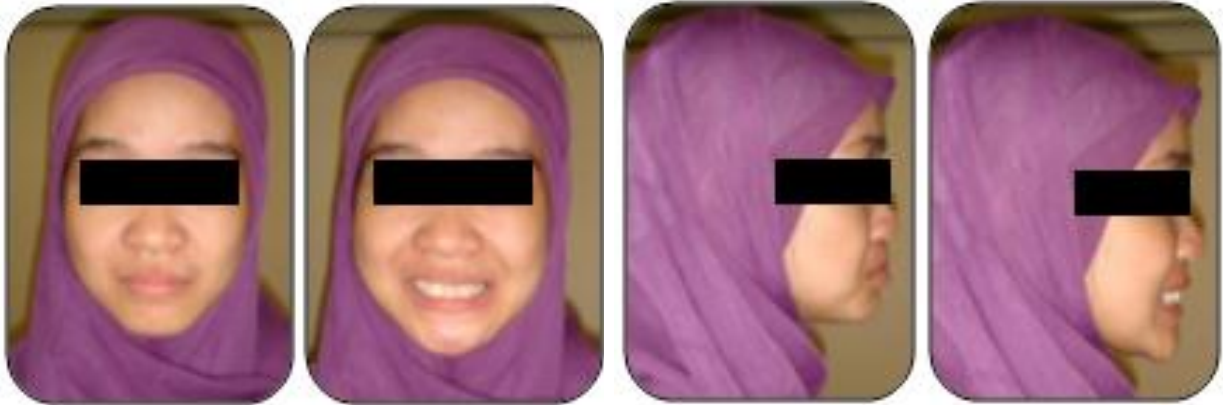
Gambar 1. Foto ekstraoral pasien sebelum perawatan