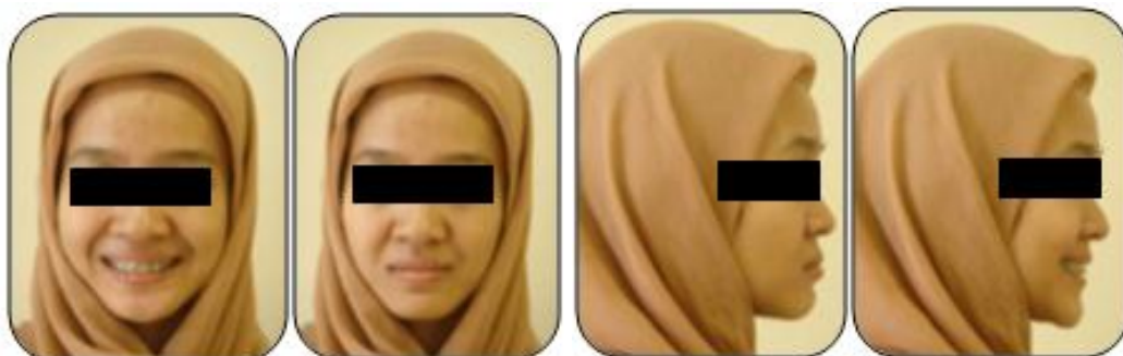
Gambar 5. Foto ekstraoral pasien saat ini