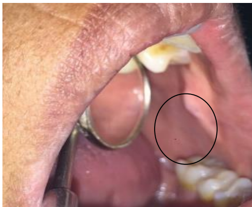
Gambar 1. Lesi nodular di mukosa bukal kiri pada kunjungan pertama

Diagnosis klinis kasus ini adalah fibroma iritasi pada area mukosa bukal kiri dengan rencana