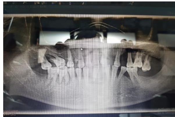
Gambar 1. Radiograf panoramik pasien

Seorang pria dewasa berusia 42 tahun datang ke poliklinik gigi Rumah Sakit Dr. Moewardi (RSDM) dengan keluhan gigi goyang dan adanya benjolan pada gusi anterior pada area edentulous, sehingga mengganggu penampilan saat tertawa maupun saat mengunyah makanan. Pada pemeriksaan klinis, ditemukan banyak gigi yang goyah dengan kondisi kebersihan mulut yang buruk,