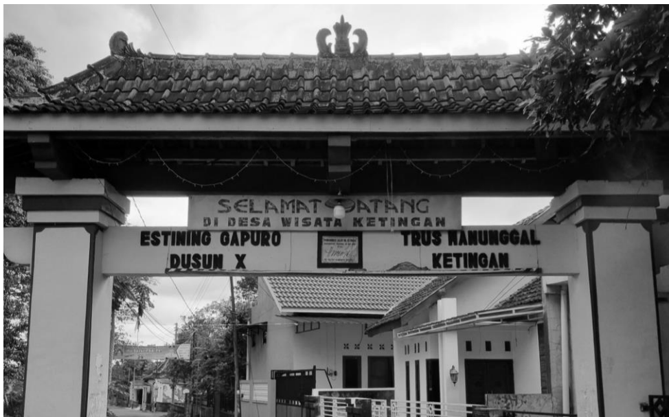
Gambar 2. Gerbang masuk Desa Wisata Ketingan