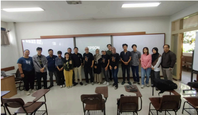
Gambar 6. Foto bersama peserta dan fasilitator.

Pelatihan kembali dilaksanakan pada hari kedua, yakni 29 September 2024. Materi Bahasa Indonesia Jurnalistik dan Editing diisi oleh Iman Haris Munajat. Dalam pemaparannya, bahasa Indonesia pada konteks jurnalisme memiliki perbedaan dengan ahasa Indonesia pada penulisan karya ilmiah. Maka dari itu, perlu diberikan materi yang sesuai. Di samping itu, melakukan pengeditan dalam berita memiliki peran penting supaya rangkaian tulisan menjadi efektif. Materi berikutnya dilanjutkan dengan fotografi jurnalistik dengan pemaparan dari Dicky Purnama Fajar, S.Sn., M.Ikom.