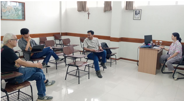
Gambar 7. Foto kegiatan forum group discussions .