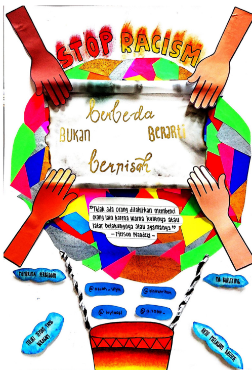
Gambar 1. Poster Stop Racism

Dalam kehidupan sehari-hari, baik daring maupun luring, hampir seluruh siswi partisipan menyatakan bahwa mereka tidak pernah atau jarang mengalami tindakan atau ujaran diskriminatif terkait ras. Wacana rasisme mereka peroleh dari pengamatan mereka di media sosial dan berbagai kanal YouTube yang terkait dengan Black Lives Matter di Amerika serta insiden-insiden rasisme di Korea Selatan. Sebagian siswi tertarik pada segala hal terkait budaya populer Korea Selatan ( Hallyu/Korean Waves ), terutama K-Pop dan K-Drama. Meski dari temuan FGD tidak menunjukkan adanya masalah siswi berhadapan dengan kasus rasisme pada saat berselancar di internet, yang menarik dalam pembuatan poster adalah bahwa salah satu kelompok justru memilih tema 'Stop Racism'