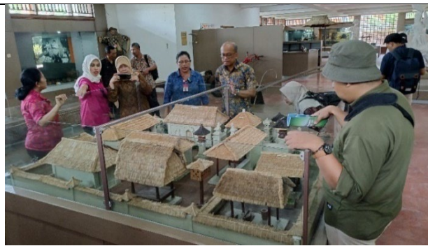
Gambar 2 Pameran Temporer (Sumber: Dokumentasi Museum Subak, 2024)