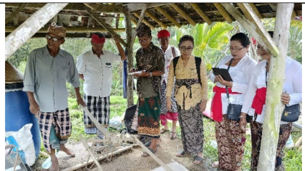
Gambar 3 Kajian Koleksi