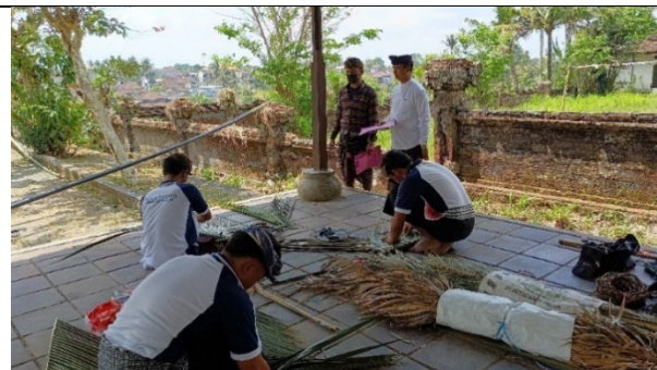
Gambar 5 Lomba Edukatif Kultural