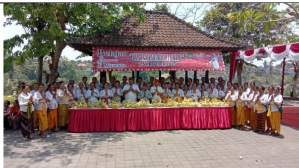
Gambar 4 Belajar Bersama di Museum