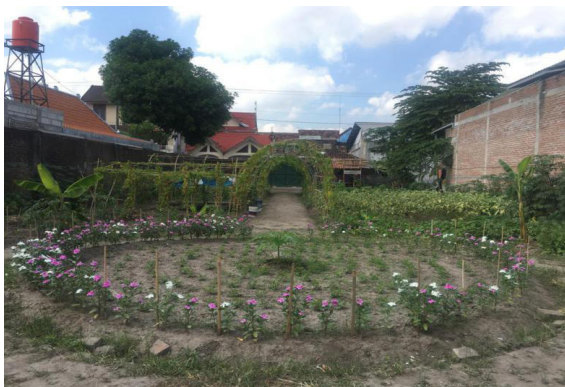
Gambar 2 Taman D'Terong

Selain modal-modal di atas kepemilikan atas modal alam juga tidak kalah penting. Modal alam terdiri atas kepemilikan persediaan sumber daya atas tanah, air, dan sumber daya alam lainnya. Modal alam merupakan potensi yang tidak semua daerah memilikinya, maka dari itu kepemilikan atas modal ini cenderung khas dan terbatas.