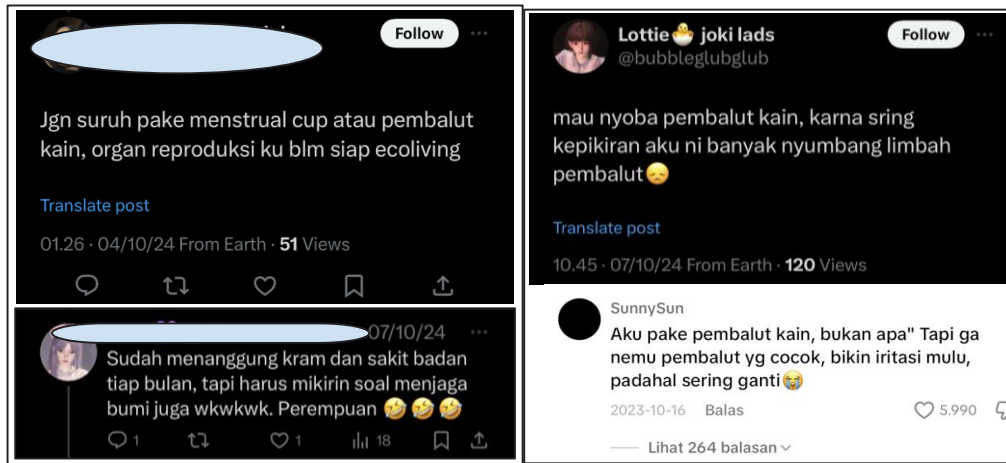
Gambar 3. Komparasi opini diskursus mainstream dan diskursus alternatif terkait lingkungan pada media sosial Twitter