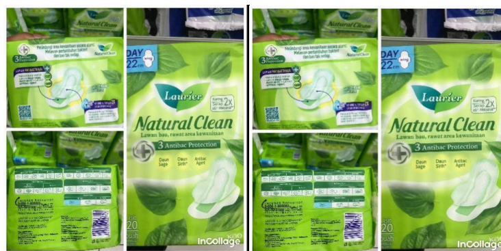
Gambar 5. Informasi kemasan pembalut plastik sekali pakai dengan narasi kesehatan

Biyung Indonesia melihat dominasi diskursus mainstream yang dikontrol oleh industri pembalut sekali pakai dan kebijakan pemerintah yang kurang mendukung alternatif berkelanjutan. Meski kemasan produk menggaungkan manfaat kesehatan, Women’s Voices for The Health melaporkan bahwa pembalut plastik juga mengandung empat zat kimiawi yang berbahaya, yaitu acetone yang memicu iritasi, styrene yang memicu kanker, chloromethane yang memicu gangguan syaraf dan reproduksi, dan chloroethan yang memicu gangguan kanker dan otot (Salsabila, 2019). Melalui petisi dan advokasi akar rumput, mereka berupaya membangun kesadaran kolektif untuk mendorong perubahan sistemik. Diskursus alternatif yang mereka tawarkan mencakup kesehatan holistik, pemberdayaan ekonomi, dan keberlanjutan lingkungan, menantang narasi dominan yang membatasi hak menstruasi. Dengan fokus pada edukasi dan kolaborasi komunitas, Biyung Indonesia menciptakan pondasi untuk perubahan jangka panjang dalam pengelolaan menstruasi di Indonesia.