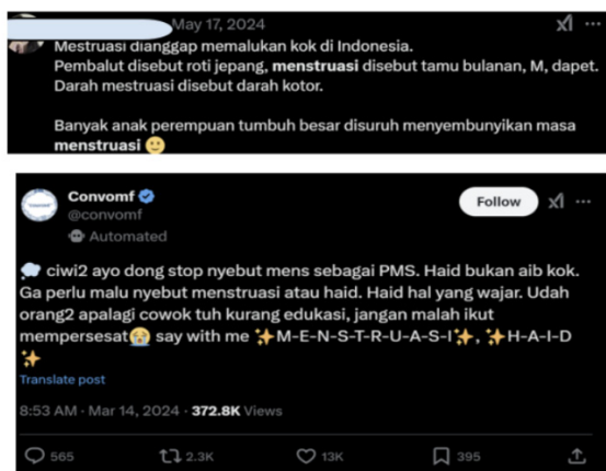
Gambar 2. Hadirnya komparasi antara opini masyarakat dalam melihat kondisi menstruasi di Indonesia yang dianggap hal memalukan dengan opini masyarakat yang mengajak kebebasan berbicara terkait menstruasi pada media sosial Twitter

Masyarakat mainstream sering menggunakan istilah samaran seperti "datang bulan" atau "roti Jepang" untuk menyebut menstruasi, mencerminkan budaya tabu. Sementara itu, kelompok alternatif lebih terbuka menggunakan istilah medis yang jelas, mendorong normalisasi pembicaraan tentang menstruasi.