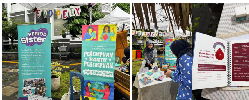
Gambar 1. Program Edukasi dan Program Donasi “Period Sisters” Biyung Indonesia dalam kegiatan Sodevfest PSDK UGM