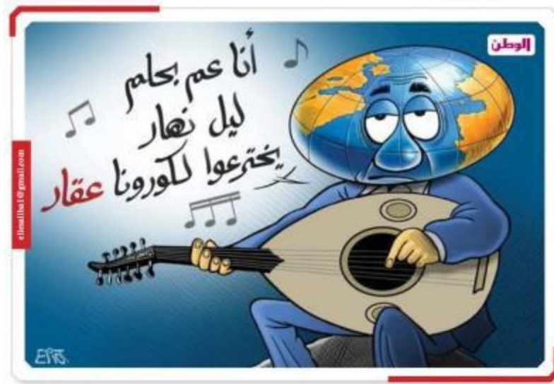
أنا عم بحلم ليل نهار يخرعوا لكورونا عقار

يتعد المجتمع المعرض بكوفي د- ١٩ للتسبب في الوفاة الناجمة عن ضعف الجسم وضعفه أحد أسباب هجوم كوفيد- ١٩ على الجسم. تعرف كلمة بحلم (بمعنى أحلم) ضمنية الأمل وأفعال الكلام التعبريات في الكاريكاتير. سمي بذلك لأن الخطاب لديه توقع ضمني بأنه في ذلك الوقت يمل جميع البشر فقط في أن يكون هناك قريبا دواء يمكن أن يساعد في منع الزيادة في عدد البشر المعرضين كوفيد- ١٩.