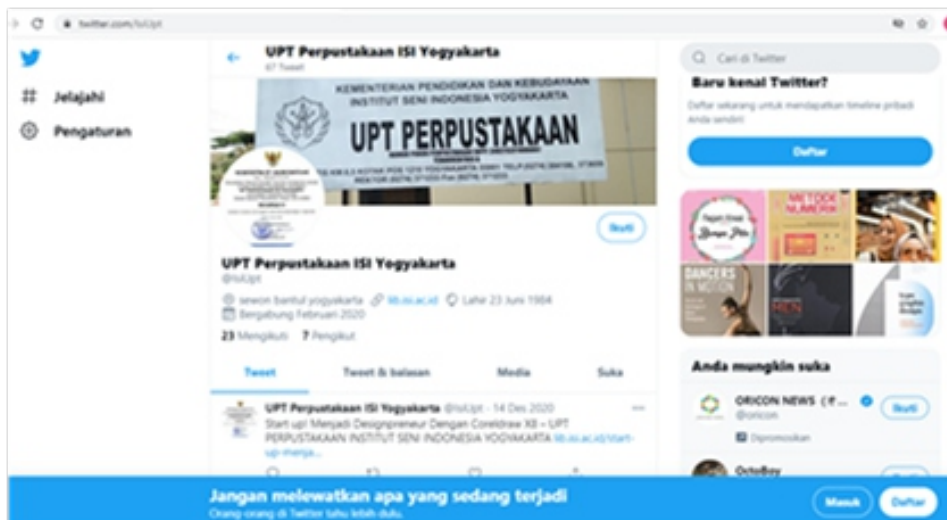
Gambar 3. Tampilan halaman depan twitter UPT Perpustakaan ISI Yogyakarta