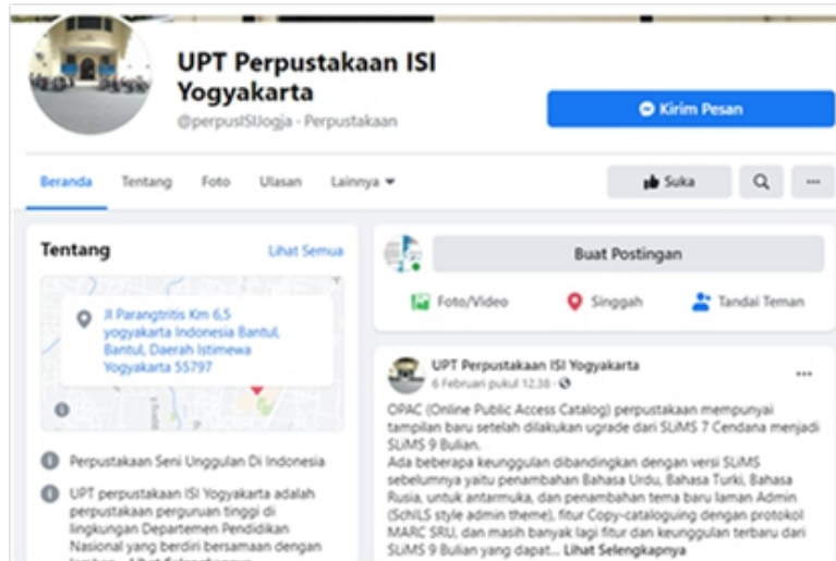
Gambar 1. Tampilan Facebook UPT Perpustakaan ISI Yogyakarta