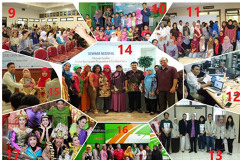
Gambar 3. Multitasking Pustakawan dalam Berbagai Kegiatan - 2