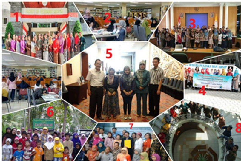
Gambar 2. Multitasking Pustakawan dalam Berbagai Kegiatan - 1