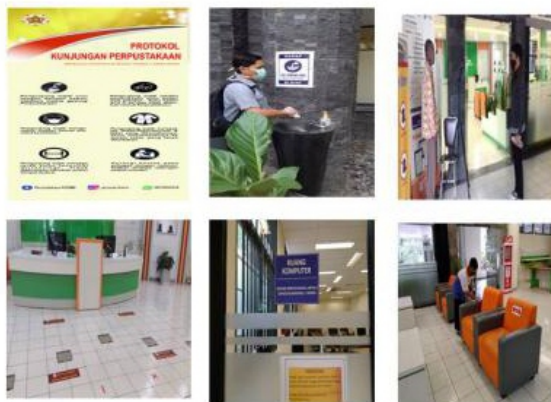
Gambar 2 Fasilitas Layanan New Normal Perpustakaan FK-KMK