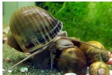
Gambar 3. Kakul 'Keong sawah ( Pila ampullacea )'

Kutipan tersebut menunjukkan adanya representasi lingkungan hidup. Representasi lingkungan hidup ditunjukkan dengan ada gunung dan telaga. Dalam lingkungan hidup, gunung adalah dataran tinggi yang memiliki sumber mata air yang jernih dan tumbuhan yang banyak, begitu pula yang dijelaskan dalam kutipan teks bahwa gunung juga memiliki air suci, terletak di tempat yang tinggi, dan dihiasi banyak bunga. Selain itu, terdapat juga telaga. Telaga adalah sebuah danau yang terletak di pegunungan. Dalam kutipan teks, telaga dijelaskan berdampingan dengan air suci pegunungan, sehingga terlihat adanya interelasi sastra dan lingkungan hidup pada gunung dan telaga. Oleh sebab itu, gunung dan telaga merupakan representasi lingkungan hidup dalam Geguritan Ēnggung .