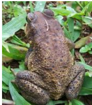
Gambar 2. Dongkang ‘Bangkong Kalong ( Bufo melanostictus )

Kutipan tersebut menunjukkan adanya representasi lingkungan hidup. Representasi lingkungan hidup ditunjukkan dengan adanya I Dongkang ‘Bangkong kolong ( Bufo melanostictus )’ 3 yang merupakan salah satu tokoh dalam Geguritan Ęnggung yang berperan sebagai seorang wanita yang jatuh cinta pada Ęnggung. Jadi, representasi lingkungan hidup yang ditemukan adalah Dongkang ‘Bangkong kolong ( Bufo melanostictus ). Selain itu, representasi lingkungan hidup juga dapat ditunjukkan dengan adanya hewan “ pici-pici ” ‘Onga jawa ( Radix rubiginosa )’ 4 yang berperan sebagai I Pici-Pici serta kutipan teks “ toya masin ” ‘air asin’. Dalam cerita, hewan tersebut merupakan tokoh yang berperan layaknya manusia. Selain itu, kutipan “ toya masin ” ‘air asin’ menyimbolkan laut dalam lingkungan hidup yang sesungguhnya berasa asin. Oleh sebab itu, representasi lingkungan hidup yang ditemukan dalam Geguritan Ęnggung terdiri atas dongkang ‘bangkong kolong’, hewan siput (onga jawa), dan air asin.