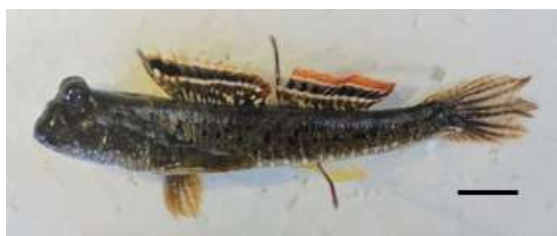
Gambar 2. Ikan glodok Periophthalmus argentilineatus yang dikoleksi dari Pantai Baros, Bantul, D.I. Yogyakarta (Garis bar = 1 cm)