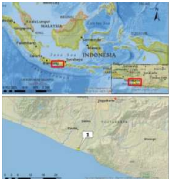
Gambar 1. Peta lokasi pengambilan sampel ikan glodok di Pantai Baros, Bantul, D.I. Yogyakarta