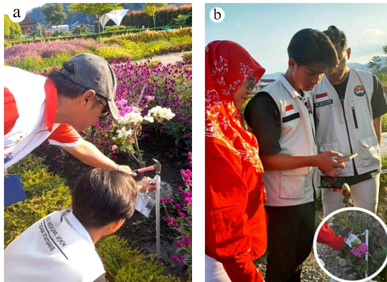
Gambar 3. (a) Proses pengadaan kartu tanda tanaman bersama pengurus Kebun Refugia Magetan (b) Proses sosialisasi dan audiensi program kerja secara one by one

Pelaksanaan kegiatan pengadaan kartu tanda tanaman ini dapat dilihat pada Gambar 3(a) , yakni dilakukan dengan mencetak dan memasang langsung kartu yang sudah terintegrasi dengan situs web di Kebun Refugia Magetan. Adapun kartu ini disambungkan dengan pipa paralon berukuran 75 cm dan ditancapkan langsung ke tanah sesuai dengan data tumbuhan yang tertera. Lokasi penempatan kartu juga diperhatikan dengan tujuan untuk mempermudah dan meningkatkan akses pengunjung. Oleh karena itu, kartu ditempatkan di lokasi yang kemungkinan besar ditempati oleh pengunjung, seperti gazebo, tempat duduk santai, dan pinggir jalan.