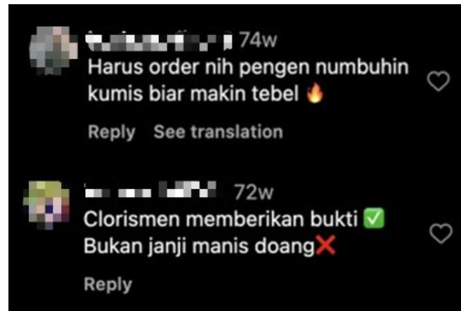
Gambar 1. Contoh buzzer suatu produk

buzzer dalam pemasaran dapat meningkatkan kepercayaan konsumen terhadap produk karena mereka cenderung mempercayai rekomendasi dari orang yang mereka ikuti di media sosial (Felicia & Loisa, 2018).