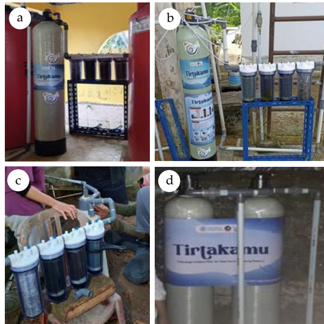
Gambar 6. (a) Instalasi lokasi pertama di masjid Kampung Bugis; (b) Instalasi lokasi kedua di Posyandu Kampung Bugis; (c) Instalasi lokasi ketiga di salah satu rumah warga di Kampung Bugis; (d) Instalasi lokasi keempat di Sumur Komunal Kampung Senggarang

kebutuhan sehari-hari, seperti memasak, mencuci, maupun berwudhu di fasilitas umum. Perubahan kualitas air ini sekaligus memperlihatkan efektivitas TTG dalam menghadirkan solusi praktis dan terjangkau bagi daerah pesisir yang rentan terhadap intrusi air laut. Pemasangan instalasi dilakukan di beberapa titik lokasi berikut: lokasi pertama di masjid Kampung Bugis (lihat Gambar 6a ); lokasi kedua di Posyandu Kampung Bugis (lihat Gambar 6b ); lokasi ketiga di salah satu rumah warga di Kampung Bugis (lihat Gambar 6c ); lokasi keempat di Sumur Komunal Kampung Senggarang (lihat Gambar 6d ).