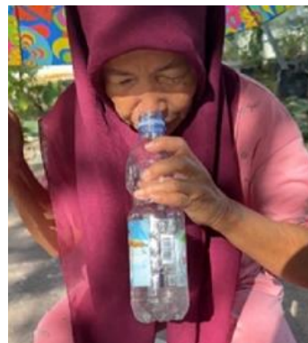
Gambar 3. Kondisi kualitas air yang berbau sebelum diolah dengan TTG

Gambar 3 , Gambar 4 , dan Gambar 5 ini memperlihatkan permasalahan nyata yang dihadapi masyarakat, yaitu kualitas air yang keruh, berbau, dan saluran pipa yang terkontaminasi endapan bauksit. Dokumentasi ini menegaskan urgensi penerapan TTG karena kondisi fisik air tidak memenuhi standar air bersih menurut Permenkes No. 492 Tahun 2010 ( Kementerian Kesehatan RI, 2010 ). Temuan lapangan ini juga sejalan dengan hasil penujian awal pada empat titik sumur yang menunjukkan bahwa kualitas air masih belum memenuhi standar air pada beberapa parameter.