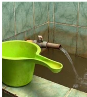
Gambar 5. Air yang keruh terlihat pada bak tampungan sebelum diolah dengan TTG

Bau terdeteksi pada sumur S2 dan S4, sementara warna air berkisar dari agak keruh (S2) hingga keruh (S4). Nilai pH berada di bawah baku mutu S2 (3,81) dan S3 (4,85) sehingga bersifat asam. TDS berkisar antara 63-145 ppm, masih dalam batas aman menurut Permenkes RI No. 492 Tahun 2010 (<500 ppm), tetapi kecenderungan salinitas tetap mengindikasikan intrusi air laut. Hasil kondisi kualitas air pada saat sebelum pemasangan TTG dapat dilihat pada Tabel 1 .