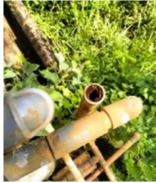
Gambar 4. Bekas Endapan pada saluran air sebelum diolah dengan TTG