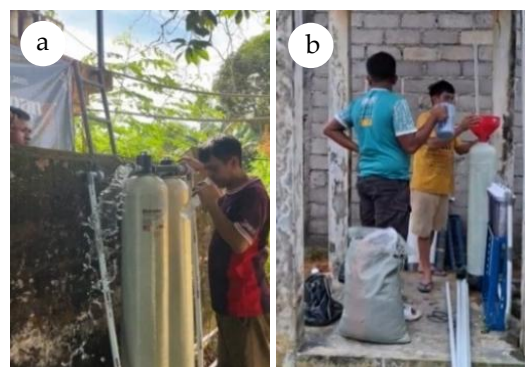
Gambar 10. (a) Masyarakat Kampung Senggarang membantu pemasangan TTG; (b) Kontribusi masyarakat Kampung Bugis dalam pemasangan TTG

Dokumentasi ini menunjukkan keterlibatan masyarakat dalam penyediaan fasilitas publik serta menegaskan pentingnya penerapan TTG untuk meningkatkan akses air bersih di wilayah pesisir. Keberadaan instalasi di lokasi-lokasi tersebut memastikan bahwa manfaatnya dapat dirasakan secara langsung oleh warga, sesuai dengan tujuan penyediaan sarana air bersih berbasis komunitas. Masyarakat cukup antusias dan bersemangat dalam pemasangan TTG yang terlihat pada Gambar 10a dan Gambar 10b .