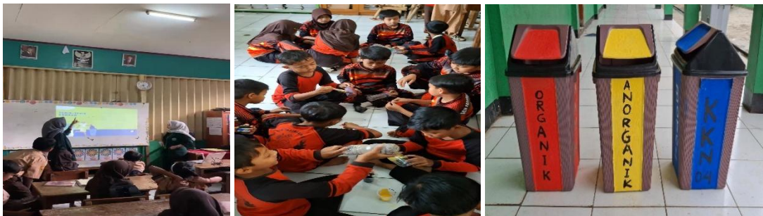
Gambar 4. Kegiatan literasi pendidikan

Pada kegiatan literasi pendidikan para siswa juga diberikan pelatihan memanfaatkan barang bekas misalnya melukis botol plastik bekas untuk dijadikan celengan atau membuat kerajinan tangan sederhana ( Gambar 4 ). Hasil kegiatan para siswa mendapatkan pengetahuan dan keterampilan baru tentang pemanfaatan sampah yang bisa didaur ulang dan dimanfaatkan untuk keperluan sehari-hari. Pemanfaatan barang bekas bisa menjadi alternatif menjadi barang tepat guna atau bermanfaat kembali (Lestanti & Budiman, 2022).