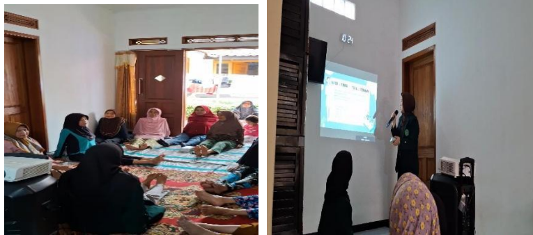
Gambar 3. Kegiatan di bidang kesehatan