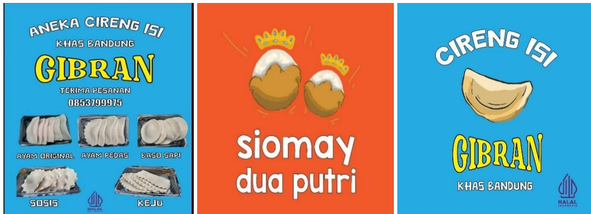
Gambar 1. Logo produk UMKM

Hasil kegiatan KKN di bidang ekonomi yaitu produk UMKM di Desa Pasir Huni memiliki brand dengan logo yang modern. Selain itu produk lokal mulai masuk ke pasar digital melalui marketplace sehingga tidak hanya dijual secara konvensional. Di samping itu, pemilik UMKM memiliki pengetahuan dan keterampilan baru tentang pemasaran digital serta meningkatnya peluang penjualan dan pendapatan masyarakat desa melalui penguatan ekonomi berbasis digital. Pergeseran dari pemasaran tradisional ke platform digital telah memungkinkan bisnis untuk berinteraksi dengan konsumen secara lebih efektif melalui iklan yang dipersonalisasi, keterlibatan media sosial serta kampanye pemasaran berbasis data (Sutanto dkk., 2024).