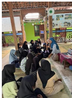
Gambar 5. Pemberian motivasi kepada anak-anak

Hasil Uji t-Test pada Tabel 3 menunjukkan nilai signifikansi ( P-value ) sebesar 5,39 \times 10^{-07} ( P \leq \alpha 0,05) dan nilai t -hitung (7,56) yang lebih besar dari t -tabel (2,10) maka dapat disimpulkan bahwa terdapat perbedaan yang signifikan secara statistik antara kemampuan peserta sebelum dan sesudah pelatihan. Perbedaan rata-rata skor ini mungkin disebabkan oleh variasi rentang usia peserta (SD hingga SMA) atau adanya akumulasi pengetahuan dari sesi sebelumnya. Setelah pretest , kegiatan dilanjutkan dengan penyampaian materi (kuliah) oleh tim pelaksana, diikuti sesi tanya jawab dan diskusi.