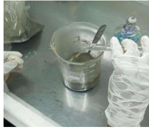
Gambar 2. Proses fermentasi tepung duckweed