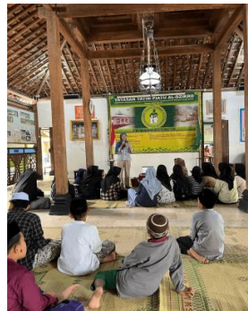
Gambar 3. Penyampaian materi dan pelatihan

Penyampaian materi dan pelatihan mengenai budidaya dan fermentasi duckweed terhadap anak-anak di Panti Asuhan Al Dzikro Imogiri, Bantul, Yogyakarta memberikan dampak positif, khususnya pemanfaatan duckweed yang dapat mendorong kemandirian ekonomi panti. Anak-anak panti asuhan diperkenalkan pada morfologi duckweed , tempat hidup, cara budidaya, dan inovasi pemanfaatannya sebagai pakan alternatif berprotein tinggi untuk pakan ikan dan ternak seperti pada Gambar 3 . Hasilnya, anak-anak panti tidak hanya menguasai teknik budidaya duckweed yang mudah dan cepat, tetapi juga mampu mengolahnya melalui proses fermentasi. Hal ini dapat membuka peluang usaha yang berkelanjutan bagi panti asuhan selain meningkatkan kualitas pakan ternak dan ikan yang berada di panti secara lebih efisien. Ditinjau dari aspek lain, kegiatan ini turut meningkatkan motivasi anak-anak panti untuk mampu berinovasi, menumbuhkan semangat wirausaha, meningkatkan rasa percaya diri dan motivasi belajar serta mampu memanfaatkan sumber daya lokal yang melimpah.