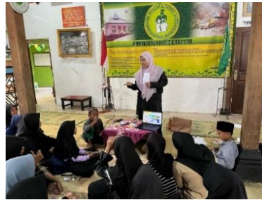
Gambar 6. Dokumentasi bersama dan pemberian akuarium untuk budidaya ikan anak asuh