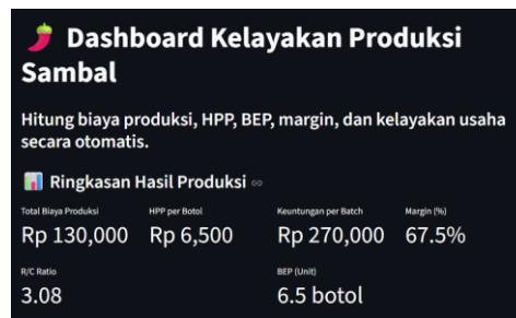
Gambar 3. Dasbor simulasi yang menampilkan dampak perubahan margin terhadap rekomendasi harga jual