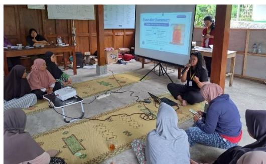
Gambar 1. Pelaksanaan penyuluhan tentang edukasi nilai tambah cabai kepada KWT Dukuh Diran

Penelitian dilaksanakan di Dukuh Diran, Desa Sidorejo, Kecamatan Lendah, Kabupaten Kulon Progo, Daerah Istimewa Yogyakarta. Pengambilan data lapangan dilakukan secara intensif pada bulan November 2025, yang terintegrasi dengan program pengabdian masyarakat Kuliah Kerja Nyata (KKN-PPM) UGM Periode 3 Tahun 2025. Lokasi ini dipilih secara purposive mengingat statusnya sebagai sentra produksi cabai yang rentan terhadap volatilitas harga serta memiliki modal sosial berupa Kelompok Wanita Tani (KWT) yang aktif. Gambar 1 di bawah ini merupakan dokumentasi penyuluhan edukasi nilai tambah komoditas cabai yang dilakukan bersamaan dengan pembagian kuesioner kepada KWT Dukuh Diran oleh tim KKN-PPM UGM.